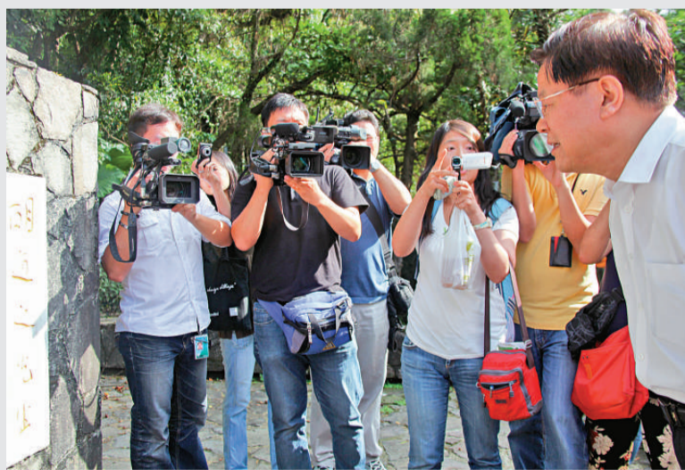
▲蔡武(右)在胡適公園瞻仰胡適先生銅像

據悉，蔡武訪台期間還將拜會中國國民黨榮譽主席連戰、文化總會會長劉兆玄、海基會董事長江丙坤，與島內眾多文化界人士進行廣泛接觸，參訪台北故宮博物院、台灣美術館、台灣工藝研究發展中心等文博機構。