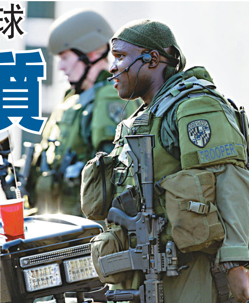
▲馬里蘭州警察在事發現場戒備

不少傳統媒體都承認，Twitter、Facebook等社交網站已經成為一個常見的新聞來源，作用有如突發消息的「預警系統」。華盛頓市的全新聞電台WTOP的副總裁吉姆·法利更說，它們的消息如此有用，新聞機構已不可以再忽略它們。