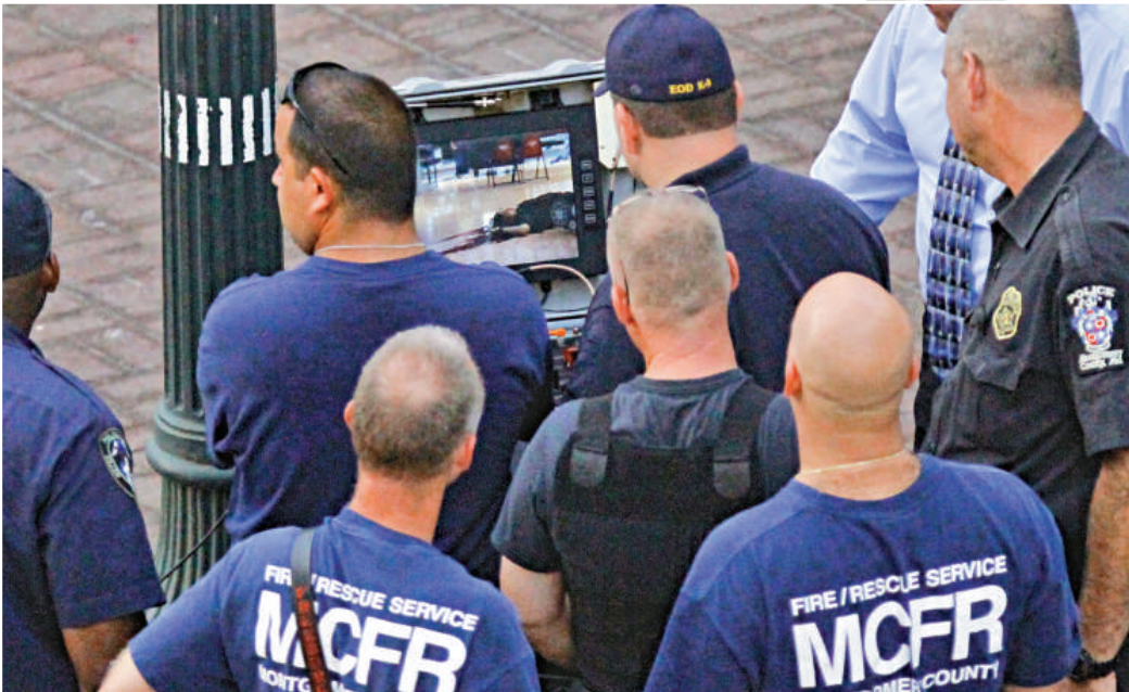
▲警方人員在閉路電視中看到槍手被擊斃後仰面躺在地板上