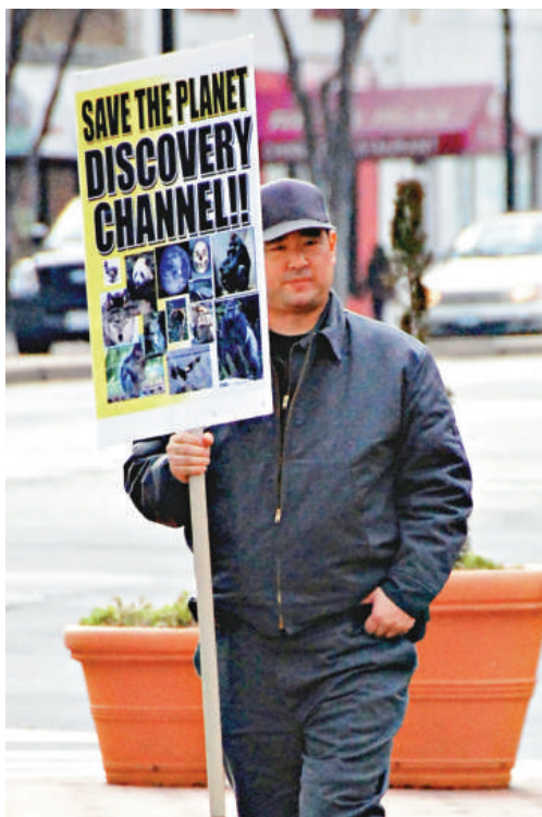
▲槍手2008年在「探索」頻道電視台總部大樓外抗議 資料圖片

現時，在Twitter上還可找到其他與李有關的資料，例如他不連貫地提出的一些要求、他的MySpace網頁地址，以及YouTube網站上一段據稱是李在2008年向天擲鈔票的片段。