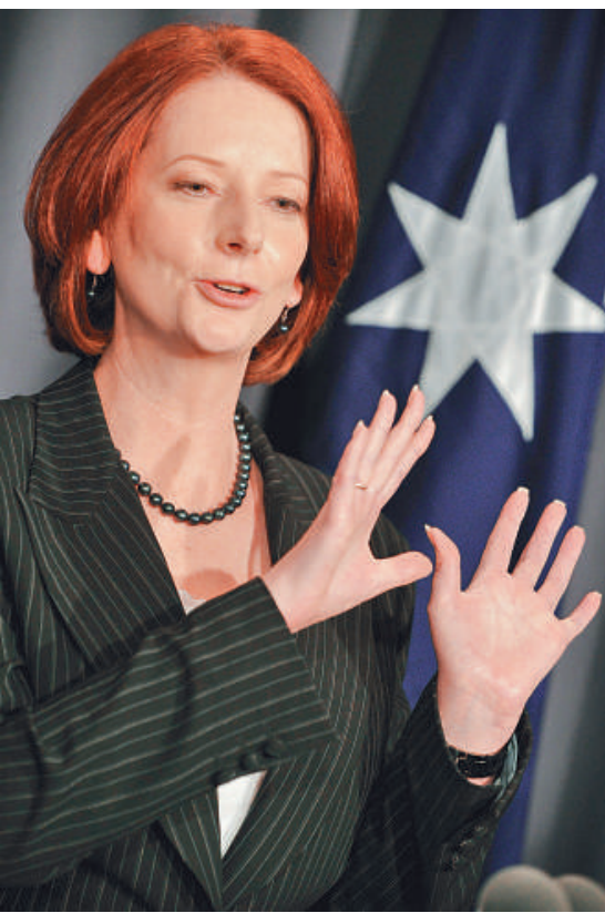
▲澳洲女總理吉拉德宣布獲得獨立議員威爾基的支持

吉拉德代表工黨與環保黨綠黨1日就組閣達成一致，簽署正式聯合協議。反對黨聯盟領導人托尼·阿博特則對綠黨黨首鮑勃·布朗表示「極度失望」，認為其在與反對黨進行正式談判前就與工黨簽署了聯合協議。