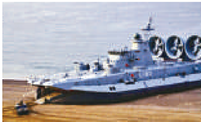
▲「野牛」級氣墊登陸艇 網上圖片

烏克蘭安東諾夫飛機製造公司正與中國相關機構進行認真談判，商談有關可能出口運輸機的問題。