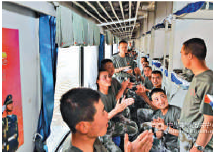
▲二中队團繞聯合軍演進行「應知應會常識知識競賽」 中國軍事圖片中心