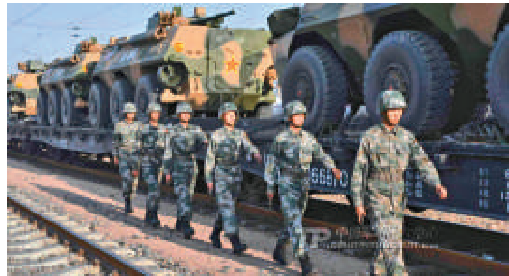
▲梯隊警戒組在中途停靠站迅速布設警戒哨