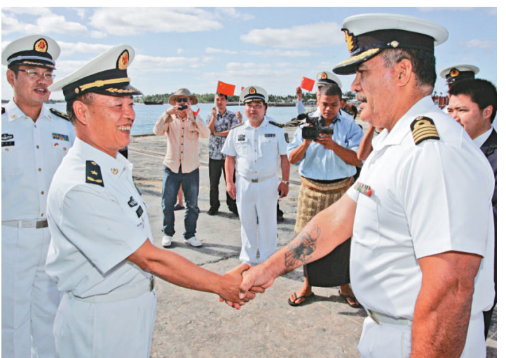
▲中國海軍出訪及遠航訓練編隊訪問湯加