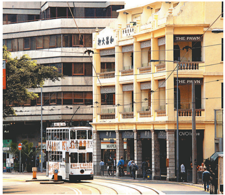
灣仔具嶺南建築風格的唐樓

灣仔是香港最早發展的地區之一。「四環九約」中的「下環」，即指灣仔。灣仔這名字是「小海灣」的意思。不過隨着城市的發展以及不停的移山填海，昔日