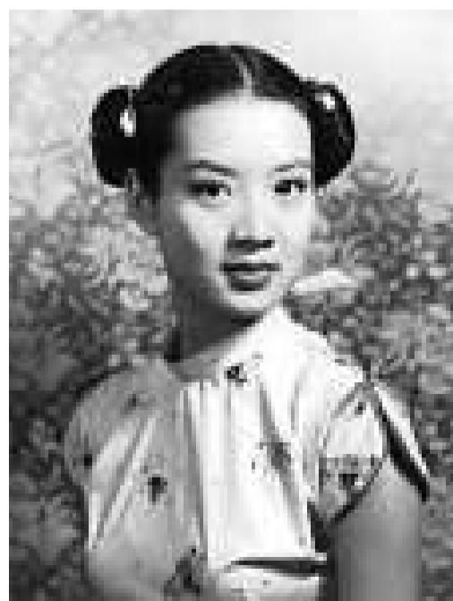
尤敏玉女形象呼之欲出

中天，「東寶」不停的邀她往赴日本全職替他們拍片；而邵氏亦不斷向她拋媚眼；但她礙於陸運濤情面，終仍與「電懋」續約，然而陸運濤其後不幸因飛機失事逝於台灣，「電懋」形勢如江河日下，尤敏頓覺意興闌珊，於1964年4月拍罷《深宮怨》(原名《董小宛》)後，便與富商高福球在倫敦結婚，經四個月歐洲蜜月旅遊後回港，隨即宣布退出影壇。