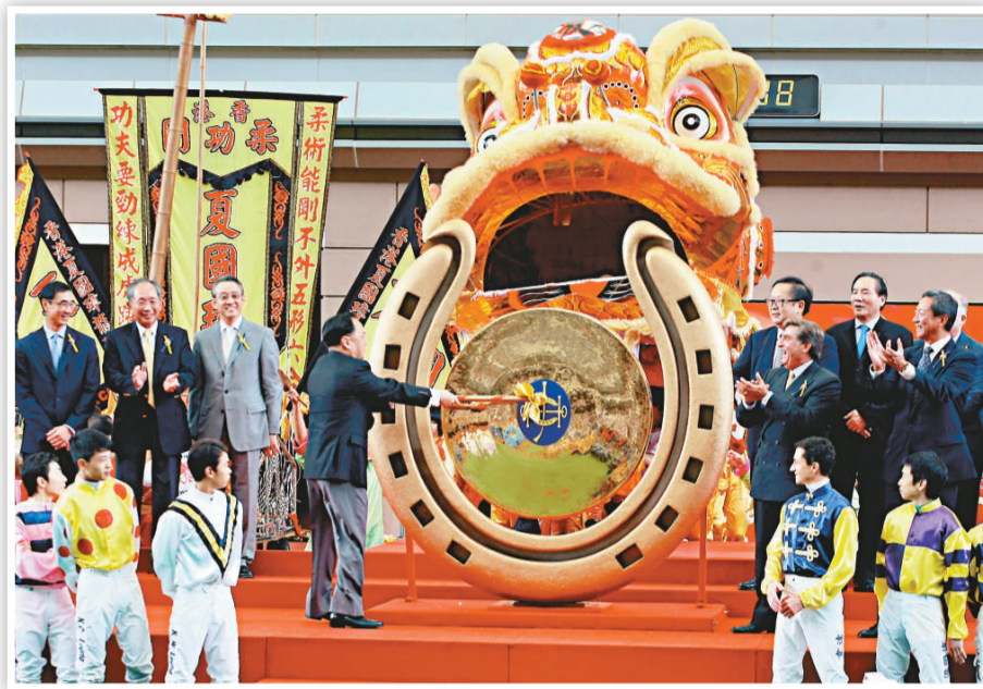
▲特首在開幕禮上敲響大銅鑼，象徵新馬季展開