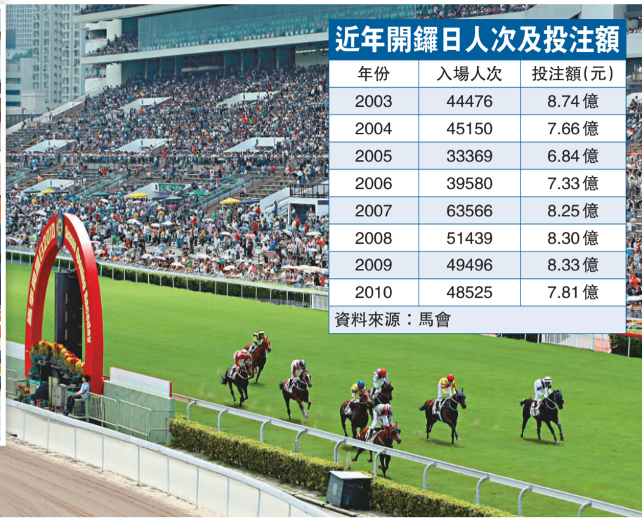
近年開鑼日人次及投注額