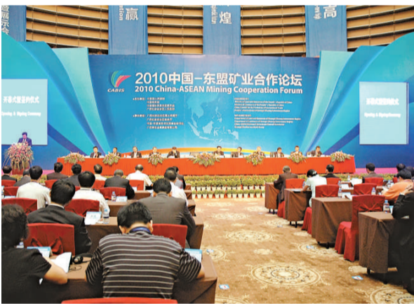
▲ 6 日，2010 中國—東盟礦業合作論壇在廣西南寧舉行

根據這份「戰略合作協議」，中國銀行廣西分行將利用自身金融服務的綜合優勢為廣西壯族自治區外事辦公室提供優質、高效、優惠和個性化的金融服務和資金支持。雙方合作內容包括：外國駐桂領事機構及其他官