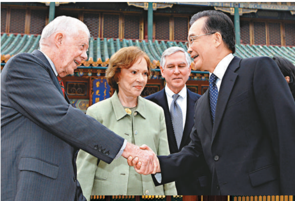
▲ 6 日下午，溫家寶在北京中南海紫光閣會見美國前總統卡特

當天上午，中國外交部長楊潔篪會見了多尼隆、薩默斯一行。雙方就下階段中美關係發展以及共同關心的重大國際和地區問題深入交換了看法。