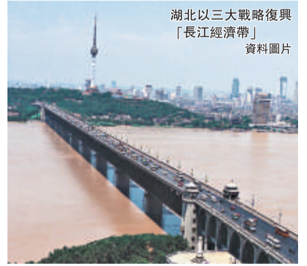
湖北以三大戰略復興「長江經濟帶」 資料圖片

規劃同時還提出一攬子試點，包括探索建立岸線資源有償使用機制、建立長江生態補償機制、探索組建沿線大型港務集團、構建跨江聯合開發試點等。