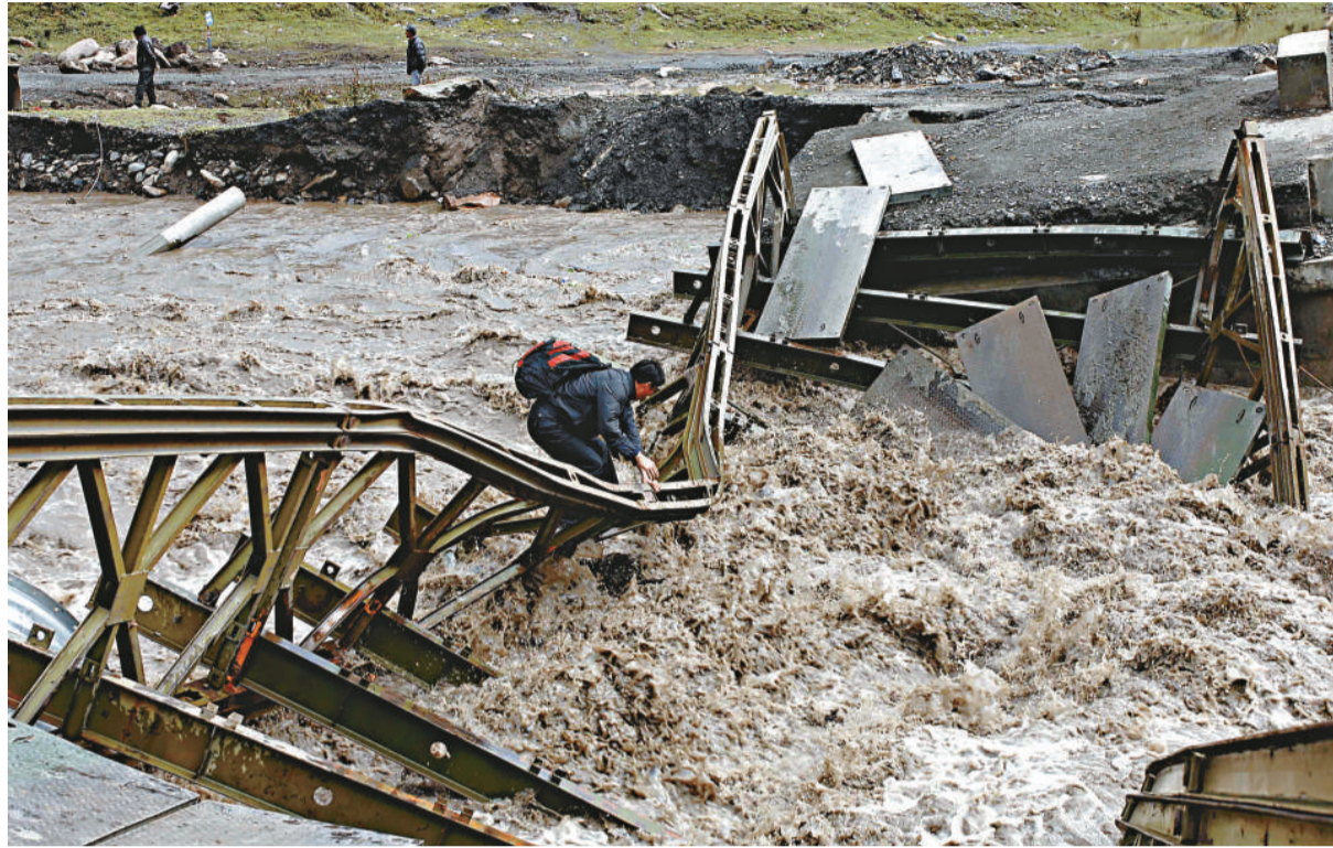
▲今年水災損失十年來最嚴重，損失高達 2000 多億元