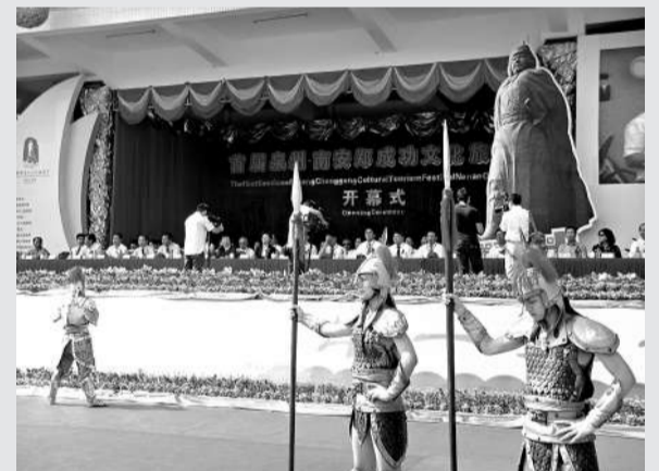
▲首屆福建泉州·南安鄭成功文化旅游節開幕式現場，身持長矛、身披鎧甲的仿古裝束兵勇成為全場觀眾的焦點

【本報記者鄧德相南安六日電】以「成功故里情兩岸一家親」為主題的首屆福建泉州·南安鄭成功文化旅游節，今天上午在鄭成功故鄉——南安石井鎮舉行。國台辦交流局副局長陳昕，國家旅遊局台灣港澳司副司長李亞瑩，台灣知名人士李楨林，日本長崎縣平戶市市長黑田成彥及參加鄭成功學術研討會的兩岸專家學者共一千五百多人出席了本次活動。