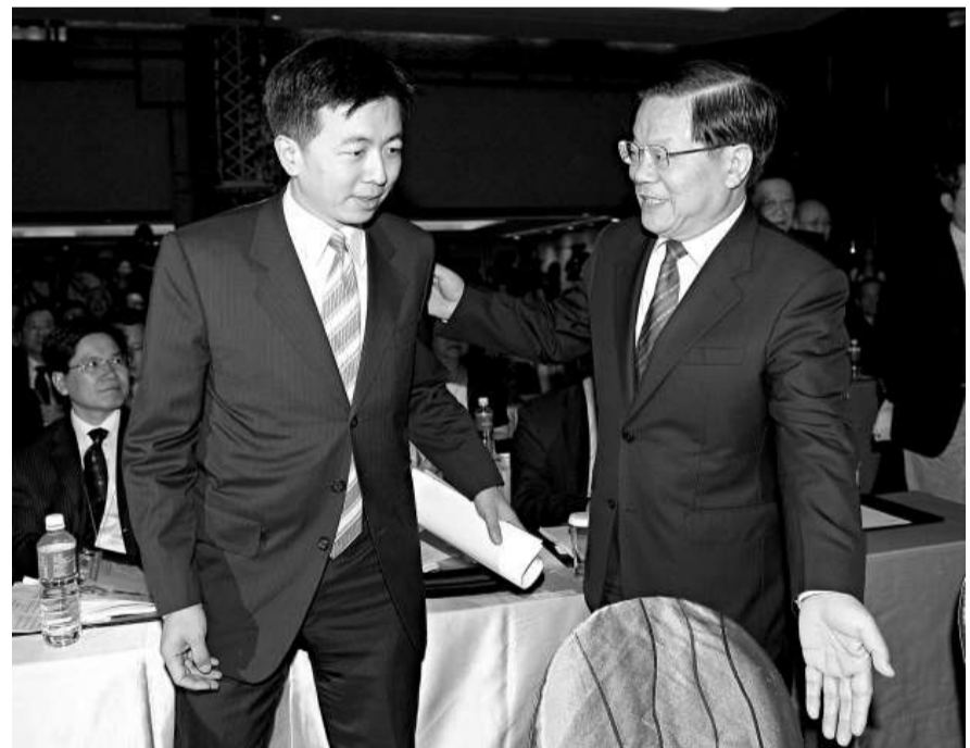
▲大陸文化部長蔡武(右)與台灣文建會主委盛治仁(左)共同走進會場準備入座時，互相謙讓 中央社

盛治仁說，他看到大陸代表團此行在行程安排上，大多是對文化機構的參訪，希望下次再來的時候，有機會去搭乘台北的捷運，逛逛永康街，找幾家巷弄裡的咖啡店坐坐，再隨意地參訪幾個台灣農村，以及遍布全台的上百個地方文化館，在這些巷弄之間，才能夠真正體會到真實的生活和台灣的文化底蘊。