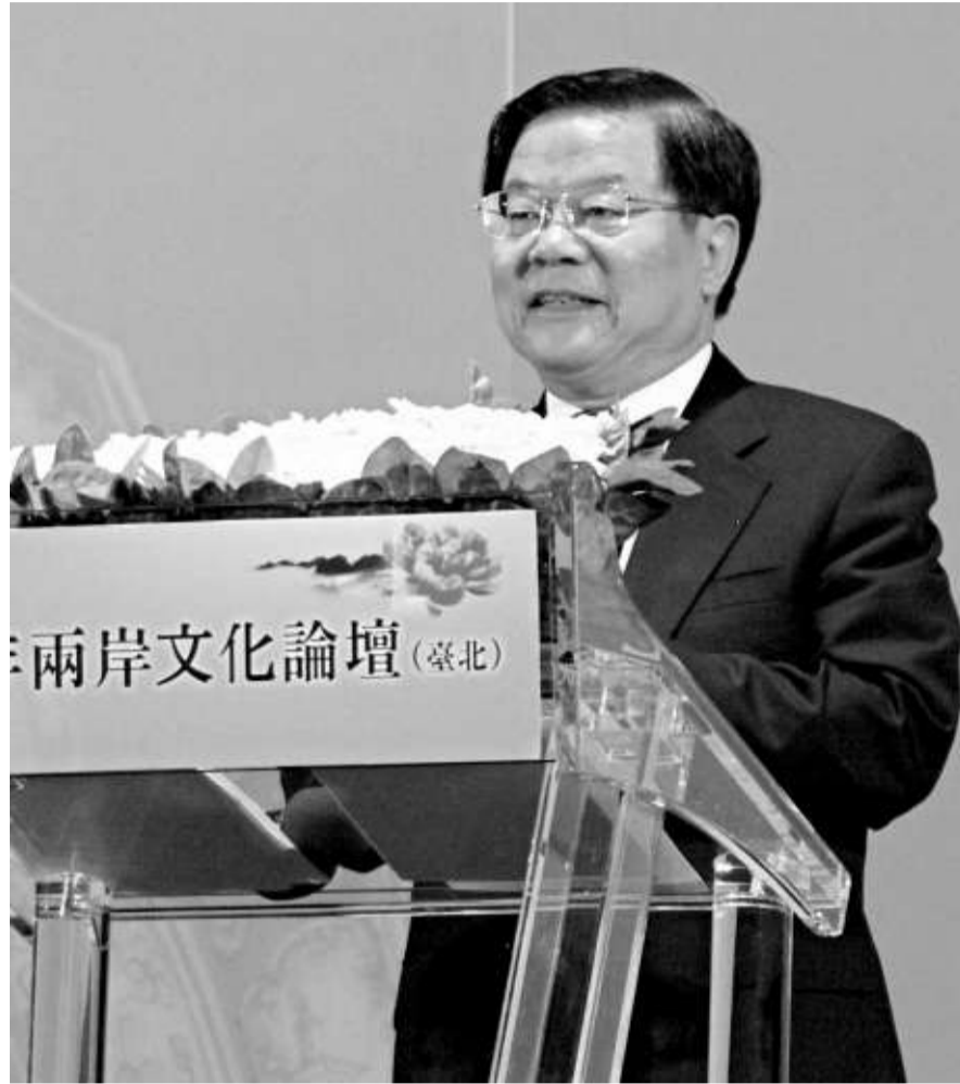
▲「2010年兩岸文化論壇」昨在台北舉行，兩岸聯合主辦單位中華文化聯誼會的名譽會長蔡武出席並致詞

蔡武在說明大陸文化產業發展現況時透露，大陸一年創作的長篇小說有三千多篇以上，每年拍攝電影四百多部、