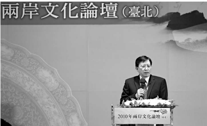
▲台灣文化總會會長劉兆玄昨出席「2010年兩岸文化論壇」並致辭