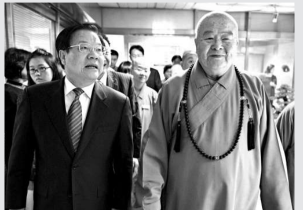
▲蔡武(左)昨日到佛光山台北道場拜訪星雲法師(右)，就兩岸文化、宗教交流互換意見

改革的創新、符合市場化的要求，與此同時，提升大陸文化服務的品味與人文關懷程度，抵制庸俗、低俗、媚俗的文化。