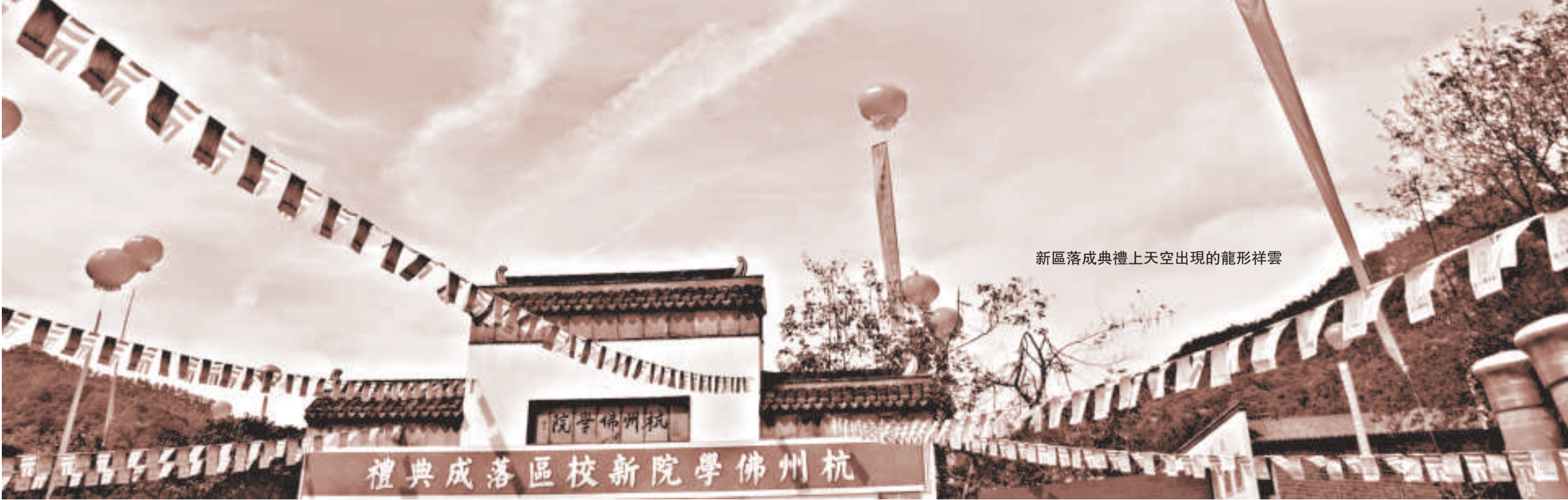
新區落成典禮上天空出現的龍形祥雲