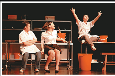
▲小演員談夢想的一幕，令人反思人生的意義

老闆和玩一下音樂，無法一下子改變殘酷的現實社會。「誇啦啦」未來還有很多有意義的事情應該做，包括製作更多涉及年輕人如何面對殘酷社會的戲，以及提供一些給成年人參與的戲劇、藝術課程和活動，思考一下如何讓工作時間因身的打工仔接觸到藝術。