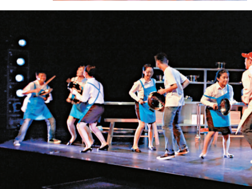
▲不少參與敲擊樂演出的學生均無音樂底子，但見台上節拍整齊，可見演出前訓練有素

作連接台上的廚房和後台的食客用餐間，不過筆者覺得若將上一落的兩排單程梯級改為只有一排可上可落的雙程梯級，眾多侍應趕着上菜而來往廚房與用餐間的混亂場面，會產生即興的戲劇效果，使戲更真實的餐廳環境；廚房的環境音效，聽來是音響設計師走到真正的餐廳廚房作實地收音，當中旺市(飯市)與淡市時的聲音明顯不同，能細緻而恰當地配合戲的不同處境。