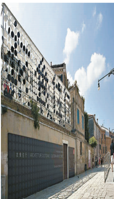
▲「衣食住行」展覽入口處特別的裝置