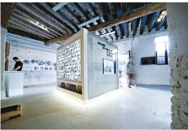
▼展品之一「住」之「密度見和諧」展示房委會為市民提供高密度但和諧居住環境的特色