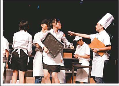
▲小演員的演技不遜專業演員