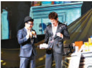
◀朴施厚（右）在粉絲見面會，分享拍劇的趣事

憑劇集《檢察官公主》人氣急升的朴施厚，本月五日下午四時在首爾祥明藝術中心舉辦了一場大型粉絲見面會，吸引來自韓國、中國內地、日本，以及東南亞國家的千餘名粉絲。《檢察官公主》另外幾位演員朴貞雅、崔松賢、韓正洙也有出席聚會，和在場粉絲分享拍攝該劇時的趣事，而朴施厚更邀請了六位粉絲上台，大送簽名照片和禮物。