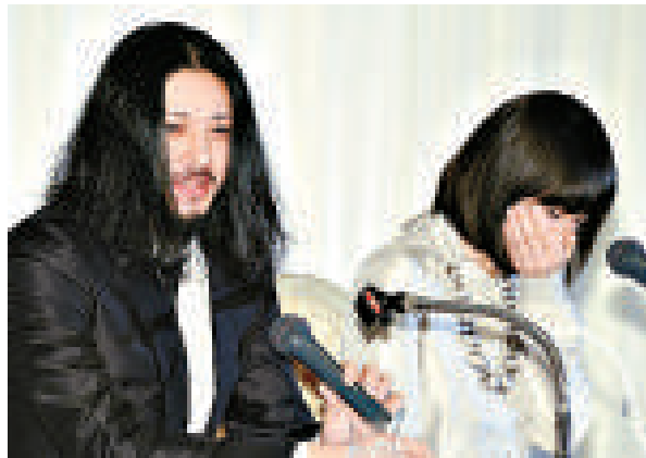
▲小田切讓（左）與香椎由宇懷孕五個月，拍畢新劇後便要放產假休息 ◀香椎由宇懷孕五個月，拍畢新劇後便要放產假休息