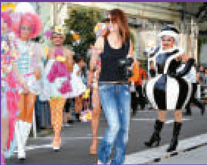
▲澤尻英龍華（右二）到場時只穿背心牛仔褲

澤尻滿載而歸，離開時更即席換上剛購入的迷你裙，有如做時裝表演。在她臨走的時候，有記者問她較早前接受CNN訪問時的「演技」事件，她今次並沒有黑面，只是笑着向記者說了句多謝。記者欲上前追問時，她身邊的保安再次發揮功能，圍着澤尻一直走上車。談到與丈夫高城剛的離婚協議，她說最近已沒見對方，現在並未離婚，至於是否想早日離婚，她馬上回答道一句「這個當然了」，全程笑容滿面，再次發揮其演技。