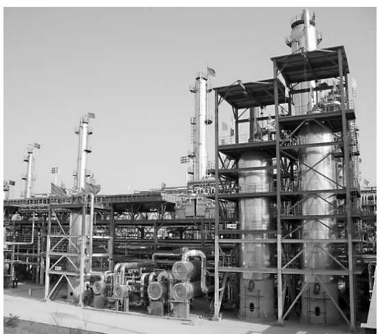
面對新機遇，能源大省陝西將加快轉變經濟發展方式，圖為120萬噸/年加氫裂化裝置

目前陝西已按照關中—天水經濟區的規劃整體部署，制訂了以西安都市圈為龍頭，加快推進西安、咸陽一體化，打造現代化的國際大都市，帶動關中城鎮群快速崛起的發展戰略。到2020年要把關中地區建設成為全國區域協調發展的新的增長極。這將為陝西和中西各國加強區域合作、加快西