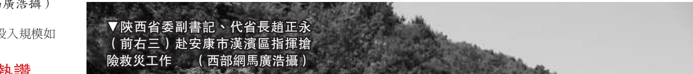
陝西省委副書記、代省長趙正永（前右三）赴安康市漢陰區指揮搶險救災工作

「我想以我的實際行動和政府的工作效力，讓老百姓認識到，這是一個心中有百姓利益的幹部，一個肯幹事、務實的幹部，一個廉潔正派的幹部。群眾有這樣的評價，我就滿足了。」2010年6月，陝西省十一屆人大常委會第十五次會議閉幕後，新當選的陝西省人民政府代省長趙正永在接受媒體採訪時坦誠地表示。 從一名知青、車間工人，到黃山市委書記、安徽省公安廳廳長、陝西省政法書記、陝西省常務副省長，直至成為一名「50後」省級一把手，趙正永一路走來，始終務實低調地踐行着他的理念。 趙正永17歲時成為安徽省宣城地區水陽公社的一名知青。19歲開始在安徽省馬鋼公司修建部機動車間做工人。1974年，趙正永在中南礦冶學院材料系金屬物理專業學習深造。3年後返回安徽省馬鋼公司，先後任馬鋼公司鋼鐵研究所團委書記、公司團委副書記等職。 1993年，趙正永出任安徽省黃山市委書記。此後8年內歷任安徽省公安廳廳長、黨委書記；武警安徽省總隊第一政委、黨委第一書記；安徽省政法書記。2001年6月，趙正永離開了生活近50年的家鄉安徽省，調任陝西，先後任政法書記、副省長、常務副省長。2010年6月他接替袁純清出任陝西省代省長。他在上任之初即表示，任內要提高人民生活的幸福指數，讓全省人民生活得更有尊嚴。 面對屬下，趙正永深情地表示，「記得在6年前，一位老常委致信鼓勵我：『鼓掌三聲解意，捧心抒志見精神，信君公諾千金價，莫負蒼天莫負民』，6年來我一直將其視為人民對公僕的期盼而珍藏於心，一直視為明鏡常照自己，一直以自己的行動默數兌現。今天，我又接過民交付的重任，我將以此為新的起點，繼續用我對黨、對人民的深情兌現我的允諾，做到不負蒼天不負民。」