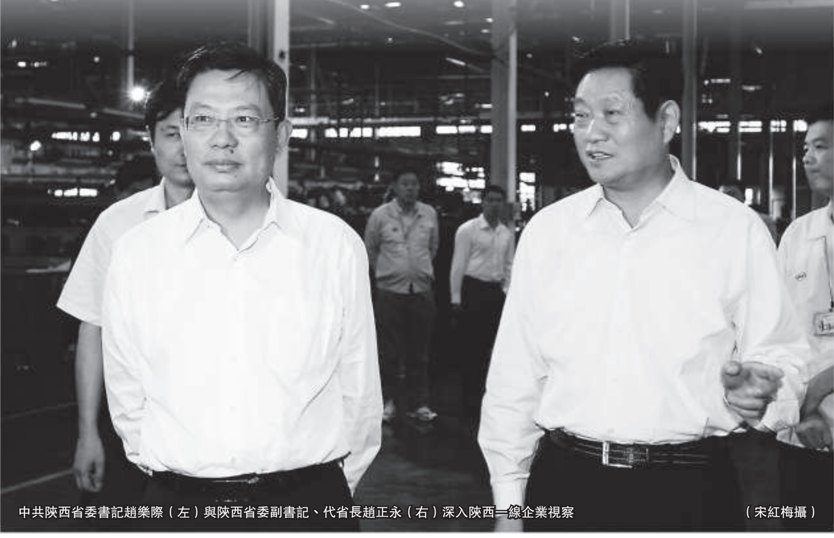
中共陝西省委書記趙樂際（左）與陝西省副書記、代省長趙正永（右）深入陝西一線企業視察