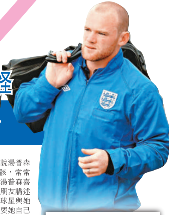
▼朗尼對友人表示不會嘗試挽救婚姻 資料圖片

《每日星報》指，除了朗尼外，湯普森還與另外13名足球員有染。他們的身家合計高達9000萬鎊，全都曾在英格蘭超級聯賽上陣，其中11人曾經入選英格蘭國家隊或21歲以下國家隊。