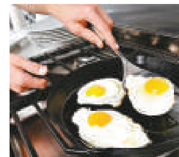
▲用來製造易潔廚具的化學品，可能會提升兒童的膽固醇水平 互聯網