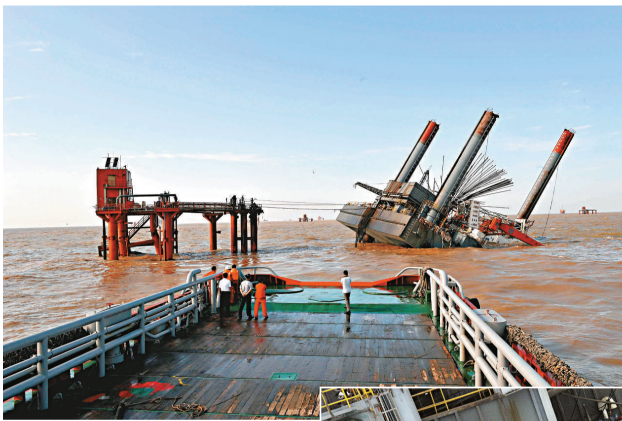
▲中國石化勝利油田作業3號平台傾斜事故海域未發現油污

5時49分，「北海救198」到達現場，「北海救113」、「北海救112」隨後也相繼到達事發海域，參與救援。5