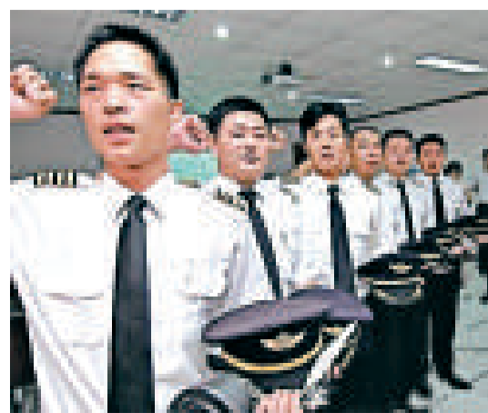
▲民航局澄清「飛行員造假」事件是發生於2008年之前的舊事

【本報訊】中新社北京八日電：針對近日有媒體披露「200餘名中國飛行員資質造假」一事，國家民航局8日公開表示，此事發生在2008年之前，民航局查出的192名資質造假飛行員已被嚴肅查處。