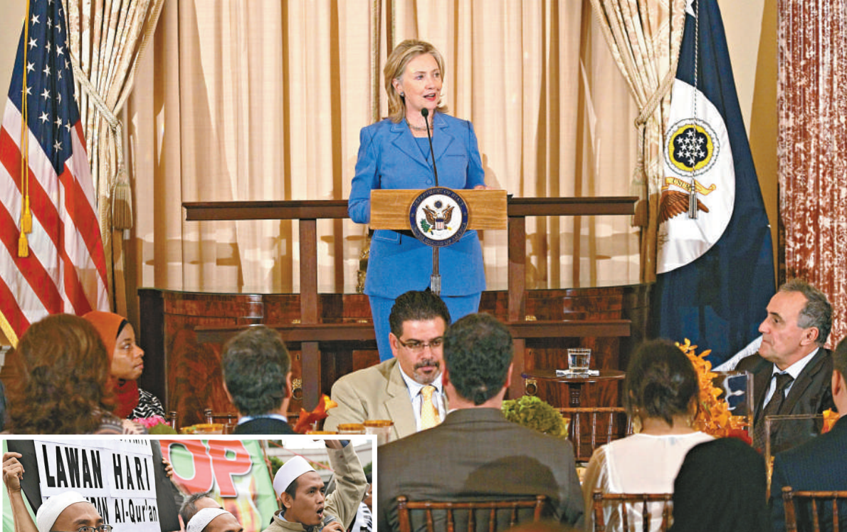
▲美國國務卿希拉里譴責焚燒古蘭經的計劃

梵蒂岡教廷9日發表聲明，指責這樣做是粗暴及嚴重的行為。教廷表示，雖然「9·11」攻擊事件是一起可恥的暴力行為，但人們不能以焚燒古蘭經來回應。每個宗教都有自己尊敬的神聖經文、祈禱場所和某些象徵