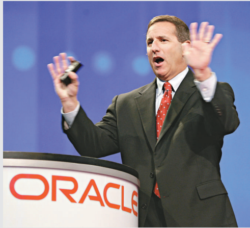
◀惠普公司前首席執行官赫德 資料圖片

另據東京都政府透露，已證實從該院轉至東京都板橋區健康長壽醫療中心後死亡的一名男子也感染了「超級細菌」。此外，東京都世田谷區的有鄰醫院自今年2月以來共有8名患者感染該細菌，已造成4人死亡。由於其中2人無法排除因感染造成死亡的可能，東京都政府7日以涉嫌院內感染為由對醫院進行了現場調查。