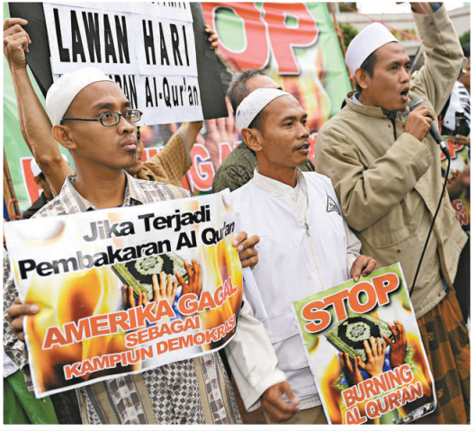
▲印尼的穆斯林和基督徒8日在雅加達聯合示威，抗議焚燒古蘭經的計劃