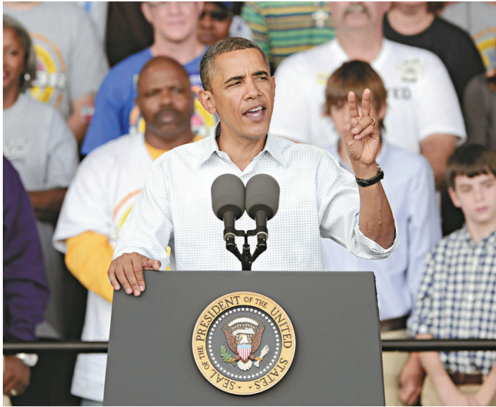
◀奧巴馬宣布不會延期富人減稅政策 資料圖片

奧巴馬此舉實際上是為了挑動共和黨人反對該計劃，這樣就可以證明民主黨的一個說法，也即共和黨人為了阻止奧巴馬的任何勝利，甚至會不惜拋棄本身的主張。