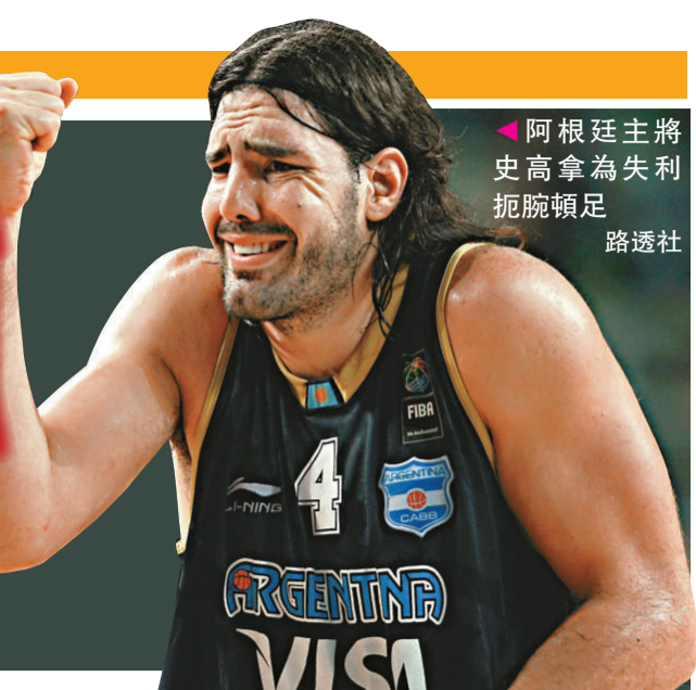
▲阿根廷主將史高拿為失利扼腕頓足