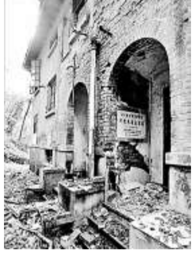
▲位於武大珞珈山南坡的周恩來舊居破敗不堪

【本報訊】據《長江日報》報導，武漢一名攝影愛好者童漢芳來信指出，位於湖北武漢大學珞珈山腳的著名別墅群「十八棟」，其中的周恩來舊居破敗不堪，童漢芳將拍攝的照片放上自己的博客，引起強烈反響，兩天之內點擊高達15萬餘人次。不少人稱「感到心痛」，並對其未來命運十分憂心。