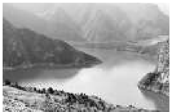
▲位於秦嶺北坡的黑河水源地

黑河的污染隱患問題一直備受關注。據西安市政協早前調查，黑河水源地一直遭受農家樂、交通運輸污染、建築和生活垃圾、礦石開採，以及森林資源破壞等五大威脅。據悉，108 國道穿越黑河流域，使得大量汽車廢氣、碳氫化合物及鉛塵、油料以及修建公路使用的瀝青和煙煤所產生的廢氣等化學污染在水源地形成了一個非點源的污染帶，每個月都有多輛化學物品車輛從 108 國道通過，帶來極大安全隱患。