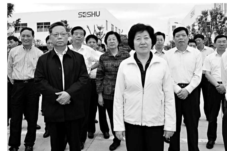
▲福建省委書記孫春蘭（前排）率閩省高層走過八閩大地後，發出了加快推進福建跨越發展的號令

與此同時，閩省新出台了石化、電子信息、新能源、節能環保等 14 個重點產業調整振興方案，既加快改造提升傳統產業，更全力推進戰略性新興產業發展。列入振興方案的新興產業重點項目共 357 個，項目實施後新興產業產值將年均增長 25% 以上。從投資結構看，上半年閩省 366 個在建重點項目完成投資 836 億元，其中高新技術產業投資增長近九成，表明科技創新、產業升級步伐進一步加快。從企業效益看，上半年閩省規模以上工業企業實現利潤 379.73 億元，同比提高 92.2%。