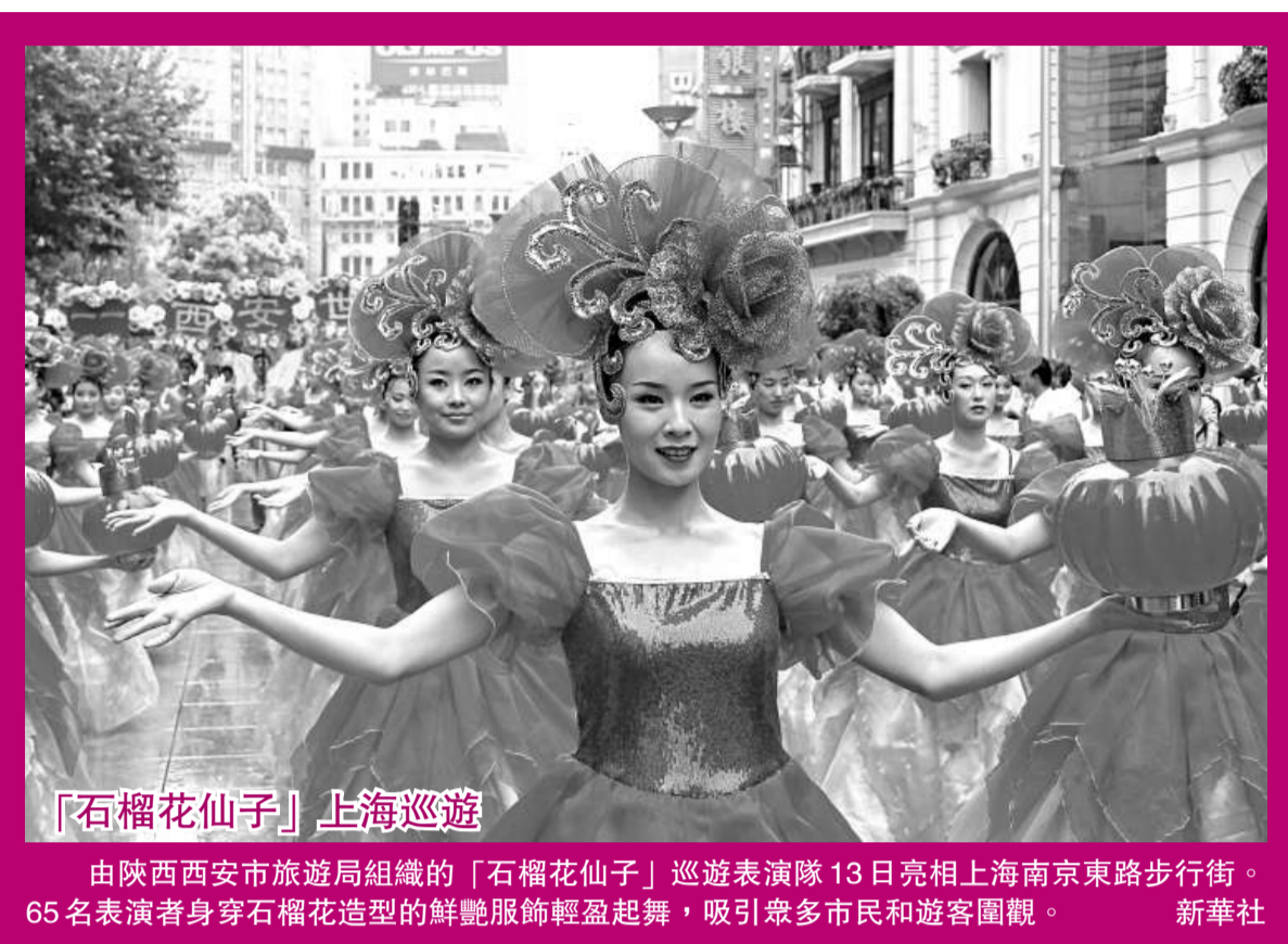
「石榴花仙子」上海巡遊

由陝西西安市旅遊局組織的「石榴花仙子」巡遊表演隊 13 日亮相上海南京東路步行街。65 名表演者身穿石榴花造型的鮮艷服飾輕盈起舞，吸引眾多市民和遊客圍觀。