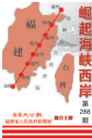
崛起海峽西岸 第 288 期 香港大公報 福建省人民政府新聞辦 聯合主辦

由著名僑領林文鏡發現並積極推動開發的福清江陰半島，未來將建成福建沿海中部最具魅力的港口新城。而隨着榕台海峽快捷走廊項目的實現，這裡將成為兩岸合作的重要平台。圖為設在福清江陰的福州新港客運站鳥瞰圖 資料圖片