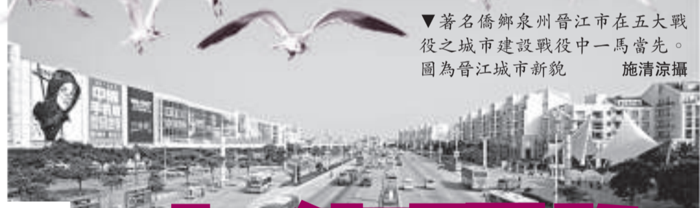
▼著名僑鄉泉州晉江市在五大戰役之城市建設戰役中一馬當先。圖為晉江城市新貌

在「海西發展已經等不起、慢不得、坐不住」的大背景下，福建省委書記孫春蘭發出了「海西必須加快速度，超常規、跨越式發展」的號召。為此，福建省委、省政府制定了一個「從 8 月份起大幹 150 天，集中力量實施五大戰役」，推動福建跨越發展的階段性計劃。上週日，福建省政府公布了「五大戰役」首月戰績，各方面進度均達到或超過預期目標，加快發展打響頭炮。尤其可喜的是，一股比學趕超的發展氣勢正在八閩大地騰騰而起。 本報記者 史兵 報道