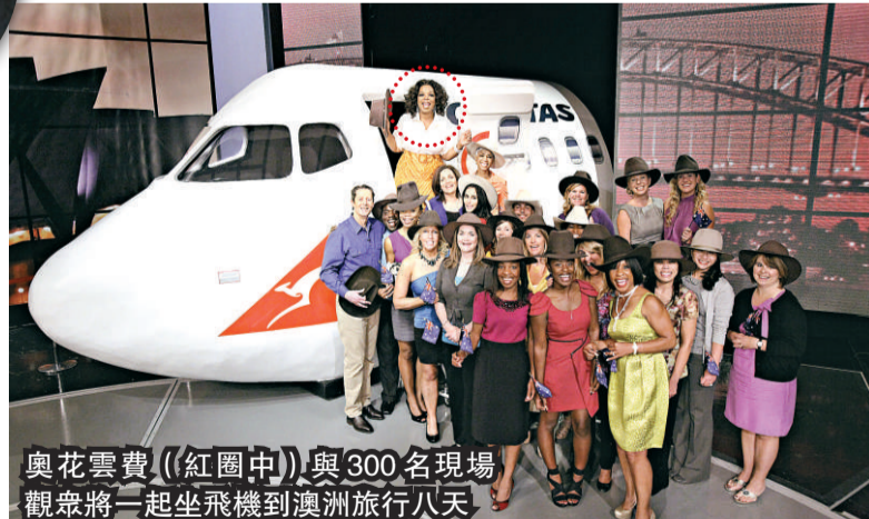
奧花雲費(紅圈中)與300名現場觀眾將一起坐飛機到澳洲旅行八天