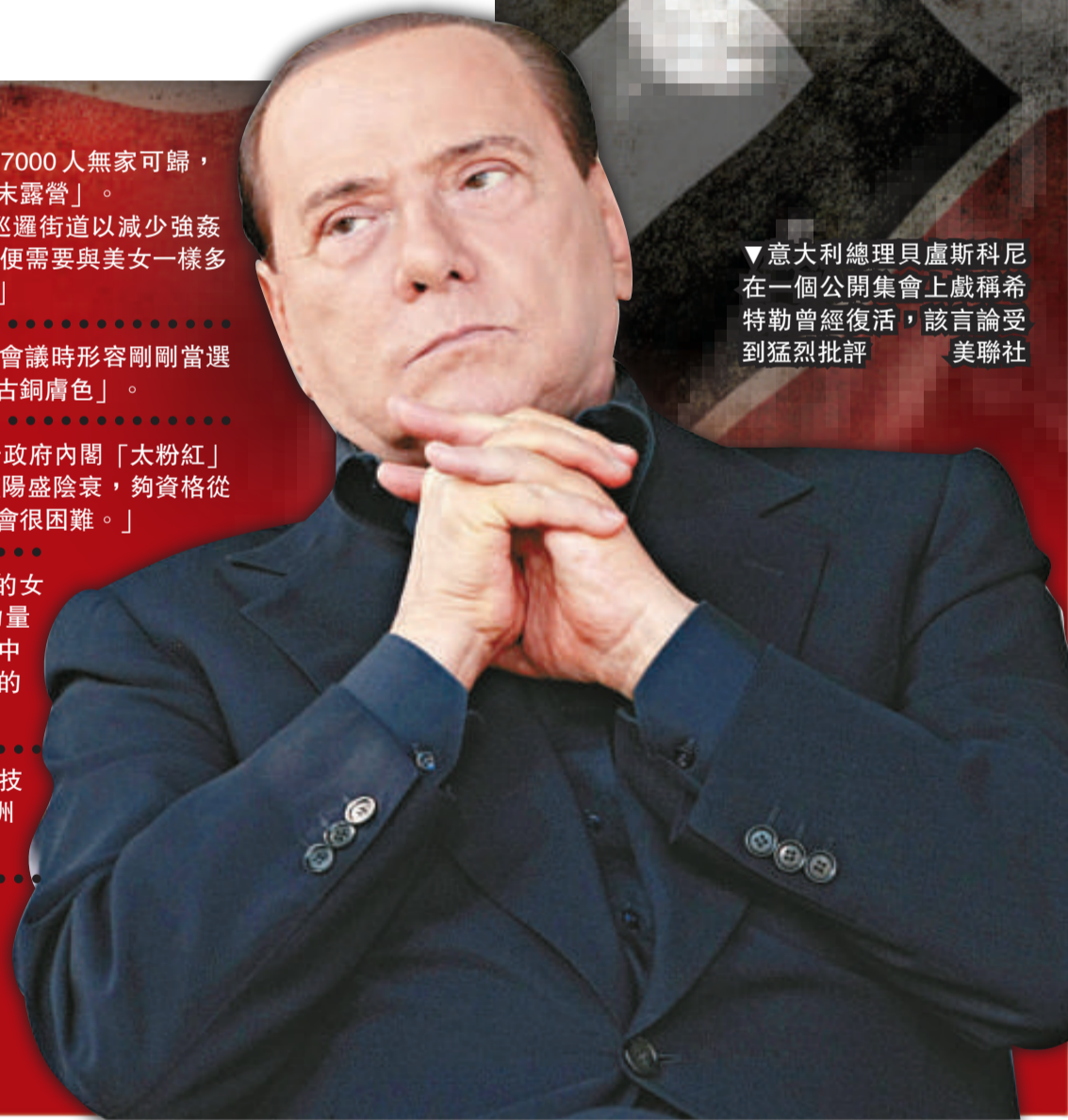
▼意大利總理貝盧斯科尼在一個公開集會上戲稱希特勒曾經復活，該言論受到猛烈批評