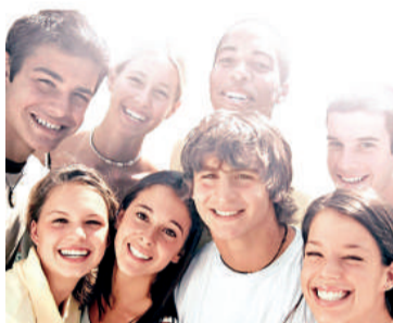
▲與親友來往較多的人，死去的可能性比社交活動少的人低50%

加州大學三藩市分校副臨床教授安東尼奧·戈梅茲說，醫生們應留意這項研究，但該研究本身也有局限。他說：「我們不可大肆宣稱社會關係增進生存能力——至少現在還不行。」他補充說，該項研究並沒有解釋社會聯繫如何增進健康，也沒