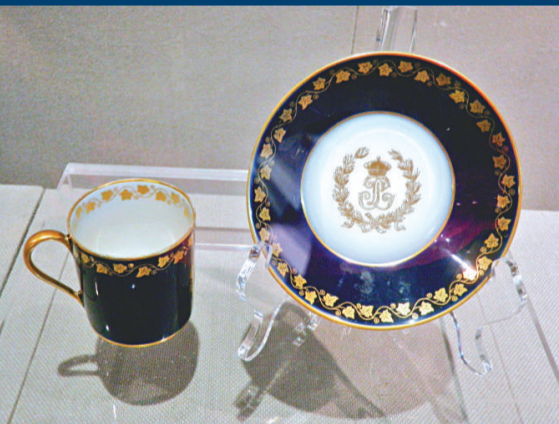
▲十九世紀描金彩繪茶杯及杯托（法國）