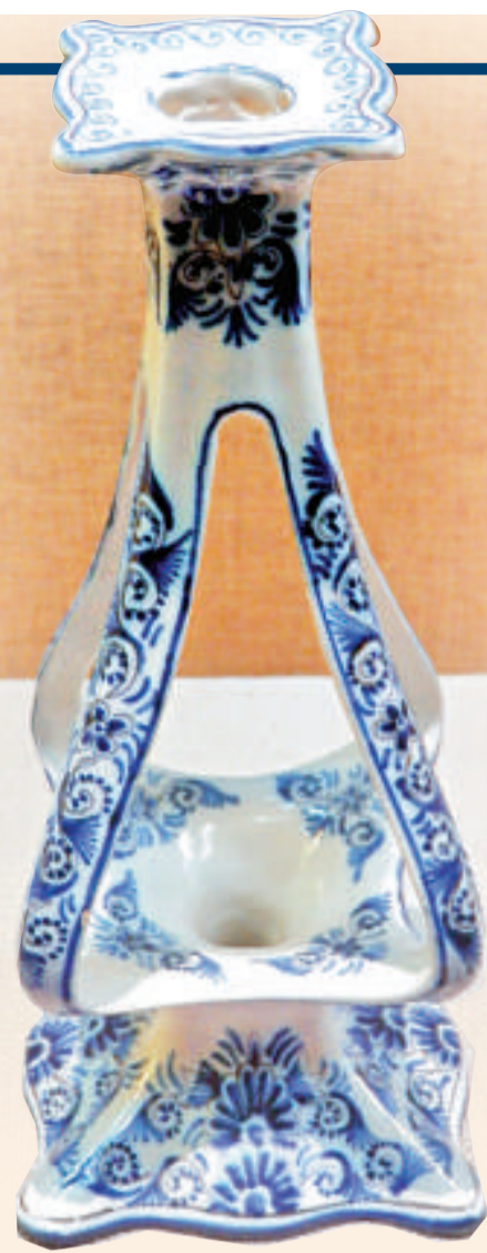
▲十九世紀青花花卉燭台（荷蘭） 本報攝 ▼「藍色洋蔥」系列餐具 本報攝

字母M.P.M.（邁森瓷器製造廠）作為邁森瓷製造廠的標誌。然而另外的一些縮寫建議也被提出，如K.P.M.（皇家瓷器製造廠）和K.P.F.（皇家瓷廠）等。一七二二年十一月八日，督察官提議，以選帝侯的盾形紋徽的局部——十字形劍，作為邁森瓷的標誌，以排除所有的混淆。自一七三一年開始，十字形標誌就在邁森瓷上面固定使用了。