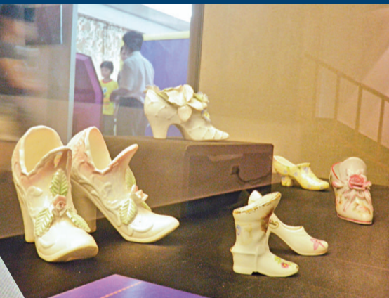
▲款式多樣的特色瓷鞋 本報攝 ▲青花商標紋大盤 本報攝