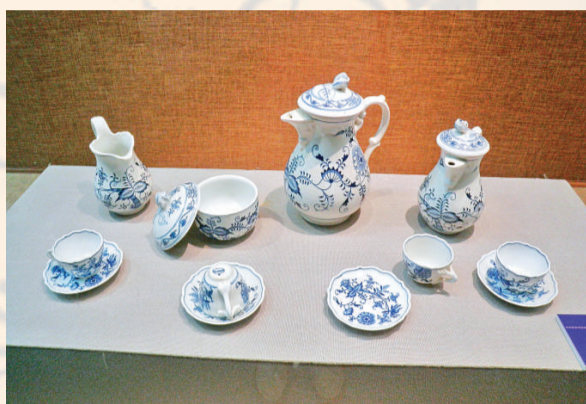
▲二十世紀早期的青花花卉紋咖啡具一組