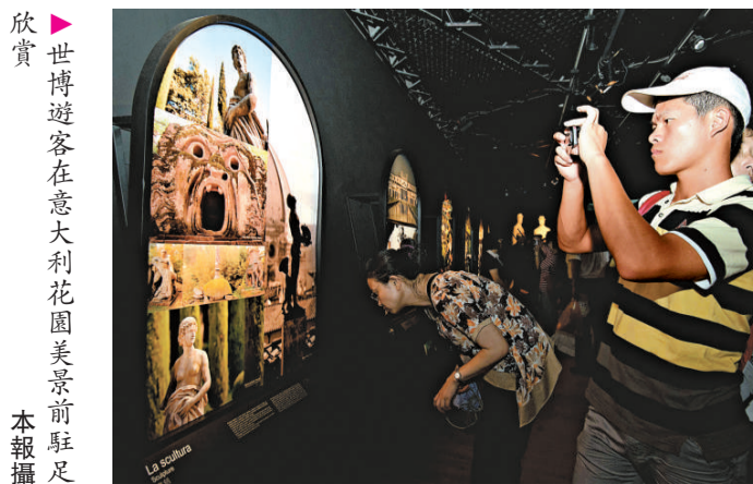
欣賞 世博遊客在意大利花園美景前駐足