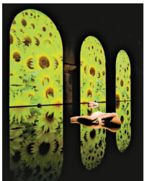
▲米莫·帕拉蒂諾的雕塑作品《睡者》，伴以意大利花園視頻展示作為背景

整個展覽更類似一個真實的意大利花園，為完善整個花園的布局和構思，展覽還將米莫·帕拉蒂諾的《睡者》和莫里奇·奧利柯的《旅行者》點綴其中。策展方希望憑藉意大利古典與現代建築的對話，通過將傳統的繼承賦予現代的詮釋，盡可能地建立新的景觀設計標準。貝良米諾·昆迭里直言，多個世紀以來，花園對意大利人而言是一個帶給人平靜並令人驚艷的地方，古典式的意式花園充滿了各種色彩，及帶有幾何意味的小徑，而當下意大利花園則更多地宣泄出藝