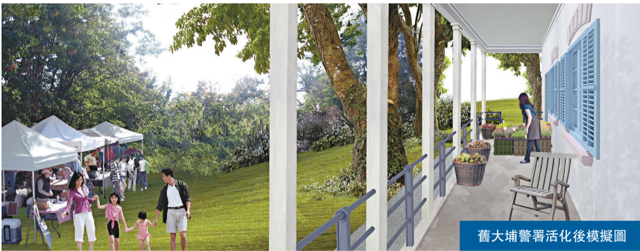
舊大埔警署活化後模擬圖