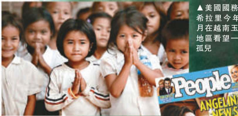
▲美國國務卿希拉里今年7月在越南玉林地區看望一群孤兒