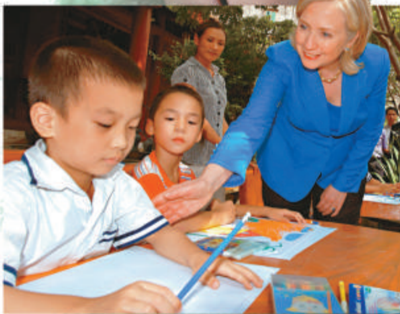
▲美越人道主義捐贈協議中為孤兒預付的押金，成為非法收養的犯罪動力