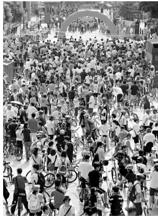
▲900市民踩單車來回中環至北角,響應「無車日」

綠色和平將於周三(二十二日)舉行無車日,現有二百零一間機構或企業承諾參加,人數約六千五百人。