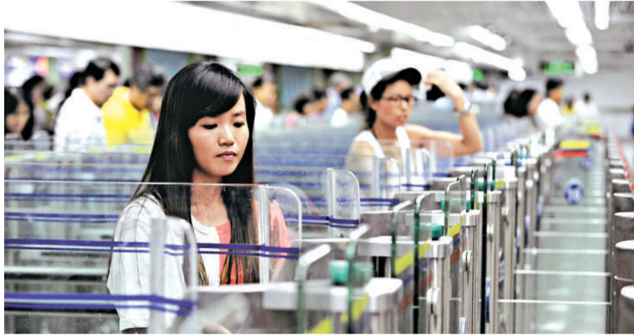
幹，分別佔兩成及一成二。

而居於香港人士的跨境行程中，五成七目的是消閒，其次是探訪親友及公幹。深圳仍然是這些行程的最主要目的地，約佔全部行程的百分之七十三。