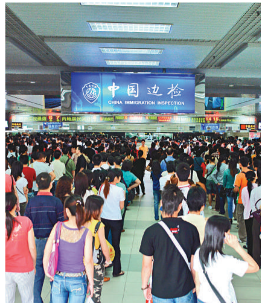
▲赴港澳團價格勁升，但無影響內地客南下熱潮

【本報記者方俊明珠海二十日電】受香港導遊強迫購物事件影響，最近國家和香港旅遊部門聯手整治赴港遊「零負團費」等問題，而引發內地不少城市赴港澳團費漲價。記者在拱北口岸採訪多個內地旅行團了解到，近期港澳遊報價最高上漲逾五成，「十一」黃金假期間仍有進一步上升空間；而毗鄰港澳的廣東客流預料以個人遊為主，較去年同期增一成左右。