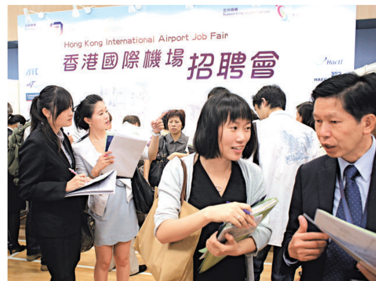
▲勞工處及機場局合辦招聘會，提供800個航空業相關職位，全日吸引3000人次到場

為現時年輕人較短視，往往只顧及薪酬而忽視就業前景。「見習飛機維修員入職月薪約六七千元，工作一年後連同津貼已可升至一萬二千元，可能對年輕人來說一年時間很長，所以他們不願意去等這一年。」吳恩豪說，見習飛機維修員晉陞階梯良好，即使是中五畢業生入職，期間經過培訓及民航處的考評後，一般八至九年可升至飛機工程師，月薪可達五萬元。