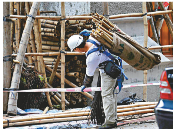
▲建築業就業人數升幅達13%

另外，政府統計處昨日出版的最新一期《香港統計月刊》顯示，本港居民去年到內地旅行的總人次中，私人旅行佔六成九，四九九萬人次，按年增長百分之五點四。當中以深圳為目的地的佔五成七，約有二千七百八十萬人次；到廣東省其他地方的佔三成七。