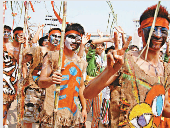
▲20日，來自中國各地以及法國和東南亞各國的3500名中外人士齊聚廣西來賓，參加「天下來賓·紅水河民族文化藝術節」狂歡巡遊

海牛分布在西非海岸、淺灣、河流以及乍得湖和喀麥隆湖中，行動緩慢，主食海藻，是海洋中唯一的食草哺乳動物，有「水中除草機」之稱。一隻成年海牛是位名副其實的「大胃王」，每頓會吃下相當於自身體重15%的食物，一天24小時中也會有8到12個小時在進食。