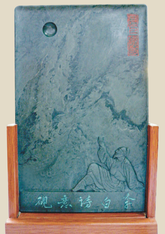
▲運用紋理和圖案勾勒出李白月下獨酌的《李白詩意硯》 本報攝 ◀《前不見古人》

《紫氣東來》硯，硯石為兩種色澤形成，俗稱「陰陽石」，作者依據硯石天然形狀和石質特點，設計雕刻出中國道教始祖老子，在大自然中修悟的意境，作者借此反映人與自然之間和諧