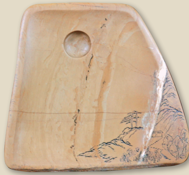
◀雙面硯《曙光》的背面，一輪陽光將和煦的溫暖傾注大地 本報攝 ▼雙面硯《曙光》正面，觀世音倚立在垂柳下凝神祝福 本報攝