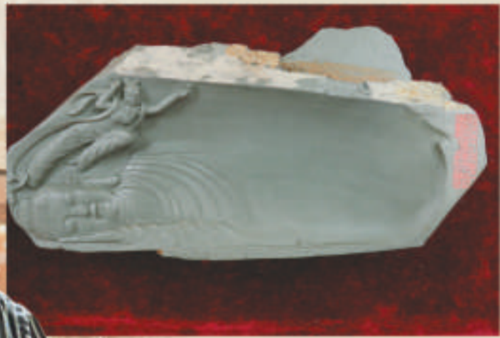
▲敦煌題材的《萬象更新》硯 本報攝