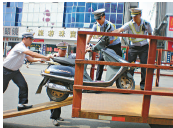
▲東莞市區禁摩後飛車搶奪案件有所減少，但仍有一些「飛車黨」在鋌而走險作案

的辦公用房，但望江縣委、縣政府考慮到縣級財力不足，無力投資建設辦公大樓，決定按照省發改委批准的單位辦公用房標準，租用縣城投公司綜合樓辦公。公告中提及，關於「望江縣政務新區位於望江縣白雲賓館對面，寶塔河北岸，佔地面積182畝」的描述並不符合實際，望江縣城投公司綜合樓建築佔地只有19.75畝，其餘為道路、綠化、市民公共活動廣場以及青少年活動中心等公益性用地。