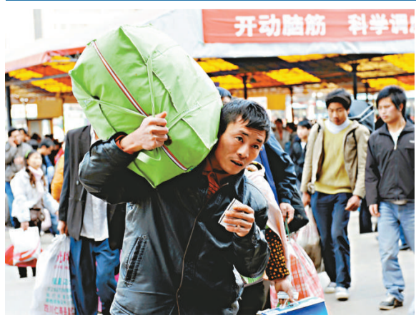
▲未來20年中國將有4億農民工變市民 資料圖片

談到城市化的潛在風險時，中國社科院人口和勞動經濟研究所所長蔡昉介紹說，農村人口面臨老齡化，農業勞動生產率的提高速度趕不上勞動力轉移速度。對此，他認為，現在是建立現代化農業的最好時機，應該用機械作業替代人工作業。