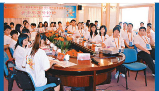
▲在非體育項目「青少年高峰論壇」上，特奧領袖、融合夥伴和指導老師在一起共同學習如何當特奧小记者