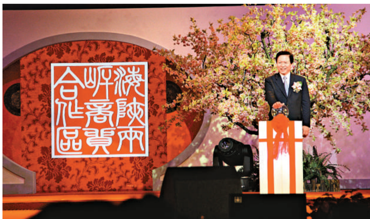
▲江蘇省委書記梁保華昨日主持啟動海峽兩岸（昆山）商貿合作區

商貿合作區內的台灣商品交易中心將配置生活居住、商務辦公、娛樂休閒等功能設施，建成集台灣商品批發零售、農副產品期貨交割、台灣企業設備和原材料採購交易於一體的台灣商品城；展示中心設立電子產品、機械產品、農產品、民生產品、製造設備和原材料等多個特色展區，成為台灣商品的多功能常年展和短期展相結合的展示平台；分撥配送中心將引進台灣物流公司，