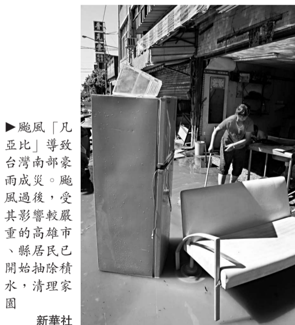
►颶風「凡亞比」導致台灣南部豪雨成災。颶風過後，受其影響較嚴重的高雄市、縣居民已開始抽除積水，清理家園。

此外，湖北省委副書記楊松21日率團參加「辛亥首義·武漢文化周」開幕活動，對於「凡亞比」颱風重創南台灣，表達慰問之意。他表示，這次到台灣正好碰上颱風，南部地區災情嚴重，他和代表團向受災民眾表達慰問。