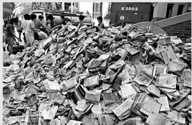
▲受颶風影響，台灣高雄文藻外語學院位於地下室的書店進水嚴重，清理出來的書籍堆積如山。新華社

唐代大詩人張九齡的「望月懷遠」，表現的是月夜懷念遠方親人的情感，渾厚含蓄，感情深摯，千古傳頌。不過其「不堪盈手贈，還寢夢佳期」則太過悲觀。「祖國統一」不會只是一個遙遠的夢，當越來越多的同胞兄弟，包括台灣同胞在內，都參與到兩岸關係和平發展的偉大事業中來，形成無比巨大的力量，那麼所形成的大趨勢就是誰也無法阻擋的。