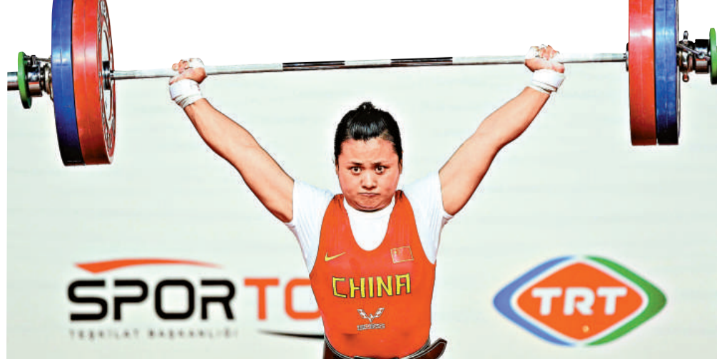
舉世錦賽中，中國選手歐陽曉芳在抓舉比賽中奪金

歐陽曉芳以挺舉129公斤的總成績獲得第5名。哈薩克選手瑪伊雅以143公斤的總成績打破世界紀錄，奪得挺舉冠軍。哥倫比亞選手尼達達以134公斤獲得第二，朝鮮選手吳正愛以130公斤名列第三。