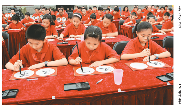
▲兩岸書法愛好者聚精會神地揮毫

活動期間，主辦方以「追憶·漢字：典藏文明之光」、「雅尚·漢字：翰墨千秋書法」、「意蘊·漢字：漢字藝術印象」、「樂活·漢字：漢字創意生活」、「感知·漢字：發現文字之美」等主題展覽以及漢字藝術講座、漢字創意服飾表演等豐富多彩的形式向社會公眾展示漢字藝術的魅力。台灣文化總會交流訪問團日前走進安陽