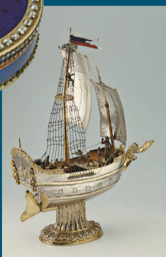
▲船形杯（銀），一七〇六年