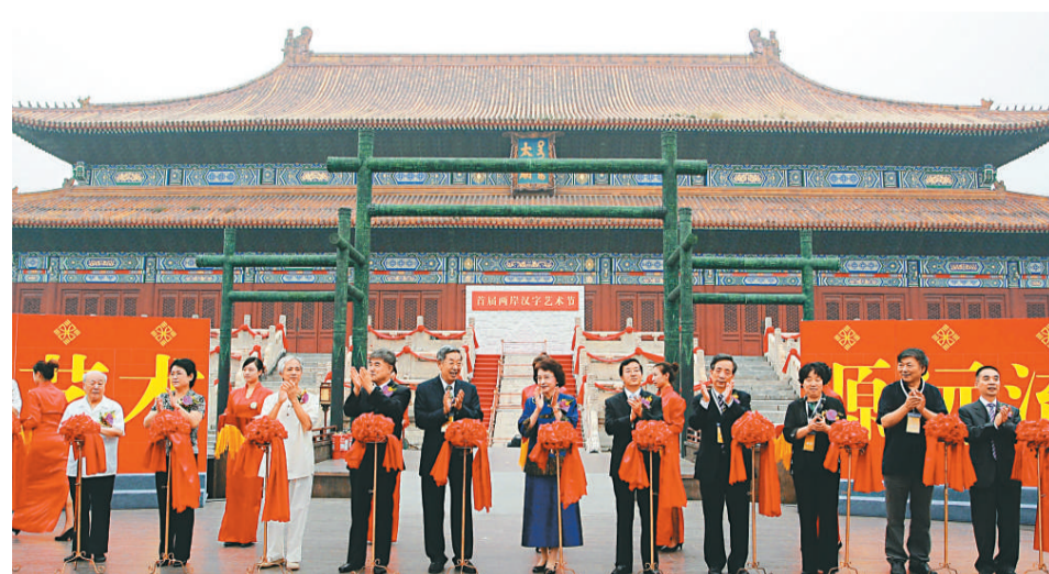
▲兩岸漢字藝術節在北京開幕

兩岸漢字藝術節是「2010中國·安陽殷商文化旅游節」重要活動之一，以「漢字藝術·源遠流長」為主題，將持續至十月二十日在北京和河南省安陽市舉行。活動旨在