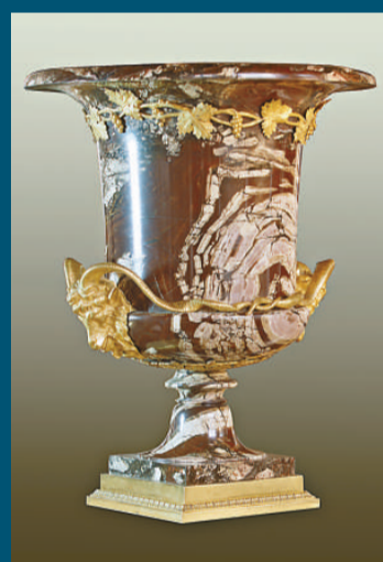
▲花瓶（奧爾斯克碧石、鍍金青銅），十九世紀初