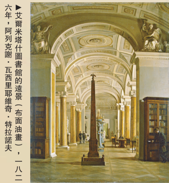
▲艾爾米塔什圖書館的遠景（布面油畫），一八二六年，阿列克謝·瓦西里耶維奇·特拉諾夫