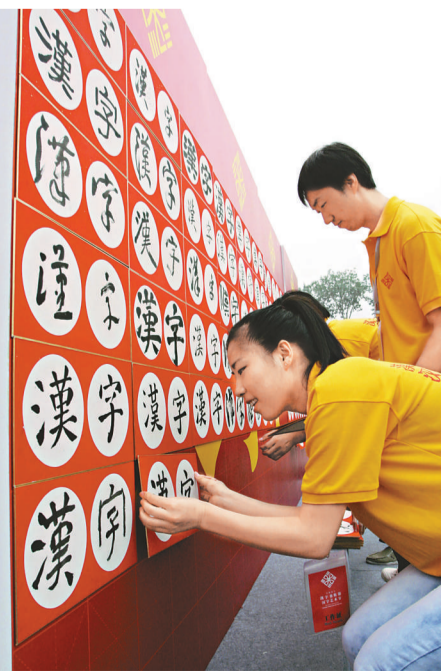
▲書法愛好者現場展示漢字藝術的魅力