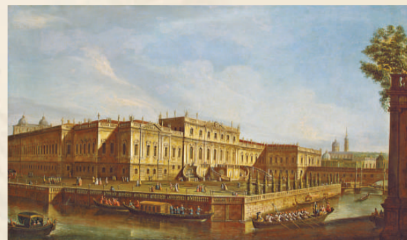
▲伊麗莎白·彼得洛芙娜女皇的夏宮（布面油畫），一七五三年

俄羅斯艾爾米塔什博物館即冬宮，與倫敦的大英博物館、巴黎的盧浮宮、紐約的大都會藝術博物館一起，並稱為世界四大博物館。該館由葉卡捷琳娜二世女皇在一七六四年創建，其藏品之前從未在中國展出。經過上海博物館與艾爾米塔什博物館近七年的策劃，「北方之星：葉卡捷琳娜二世與俄羅斯帝國的黃金時代」展覽正在上海博物館舉行至十二月十二日。展品包括二百九十件來自艾爾米塔什的文物，涵蓋彼得一世、伊麗莎白女皇、葉卡捷琳娜二世、亞歷山大一世四位君主統治俄羅斯期間的繪畫、瓷器、金銀器、雕塑等精品，其中尤以艾爾米塔什博物館的葉卡捷琳娜二世時期的收藏為最。展品反映了十八至十九世紀俄羅斯乃至歐洲手工藝術的最高水準。上海博物館館長陳燮君介紹，這樣的展覽規模在上海博物館近十年的展覽歷史上也是少見的。