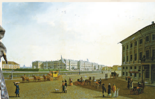
▲從涅夫斯基大街看冬宮（布面油畫），約一八〇〇年，本杰明·帕特森