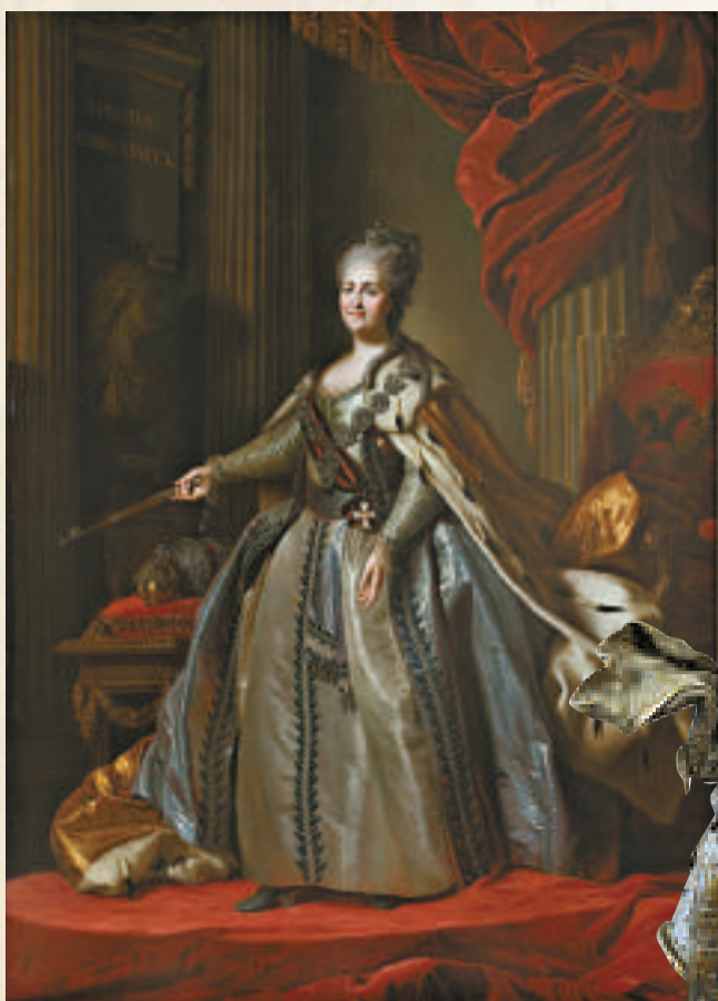
▲油畫《葉卡捷琳娜肖像》，創作於十八世紀七十年代，畫家佚名 ▲彼得大帝半身像（青銅），一七二三至一七二九年