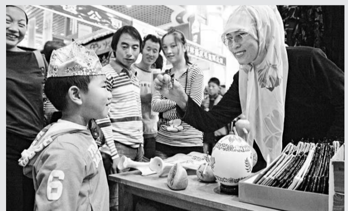
▲二十四日，一名穆斯林小朋友在展會上試戴六瓣帽

寧夏回教自治區政府主席王正偉說，本屆回商大會以「弘揚回商精神、彰顯回教文化、實現合作共贏」為主題，通過開展項目簽約、清真食品穆斯林用品展銷、清真美食節、回鄉文化旅遊節等系列活動，使更多的回商走出中國，走向世界，開啓中國特別是寧夏與阿拉伯國家和穆斯林地區的經貿文化交流的新路。