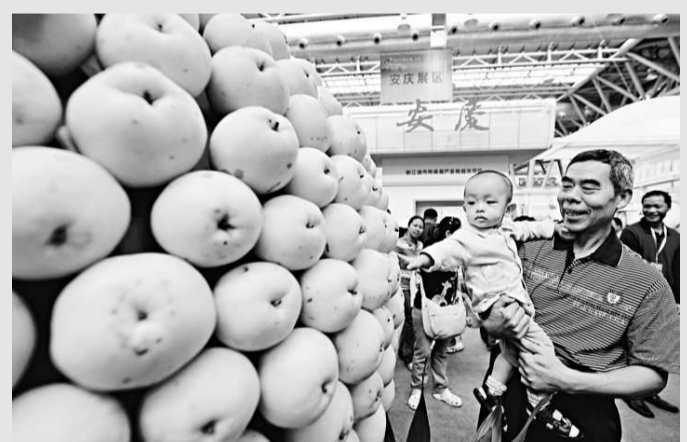
▲二十四日，參觀者在農交會上觀賞一家參展企業製作的特色水果糖

據悉，本屆農交會簽約總項目將達85個，涉及金額215億元。簽約項目涉及現代農業科技示範園建設、生態農業觀光旅遊基地建設、畜牧養殖基地建設、特色農產品生產線開發及農產購銷等多個領域。與上屆農交會相比，本屆農交會簽約項目呈現規模化、產業化、基地化、專業化、都市化等新特點。其中，生態農業、優勢產業和特色產業備受投資者青睞。