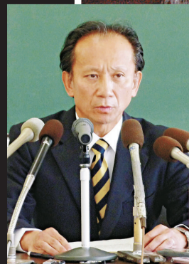
▲日本沖繩縣那霸地方檢察廳檢方負責人鈴木亨出席記者招待會 新華社