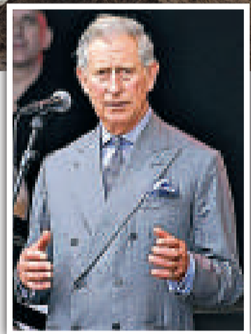
▲英聯邦運動會召開在即，新德里的主要體育場館還未完工

報導指出，印度最終打敗加拿大成功贏得申辦資格。實際上，加拿大也向每個國家提供了7萬美元的賄賂。