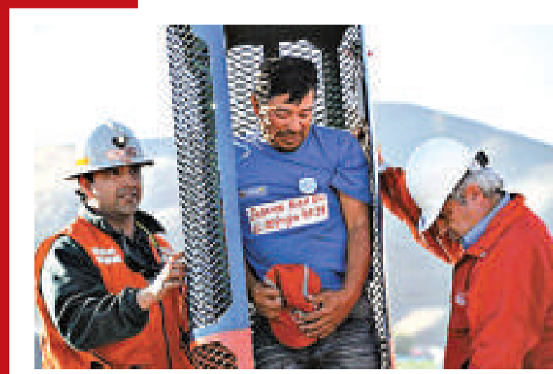
▲營救被困礦工的「救生艙」運抵塌方礦場，工作人員正在進行試用