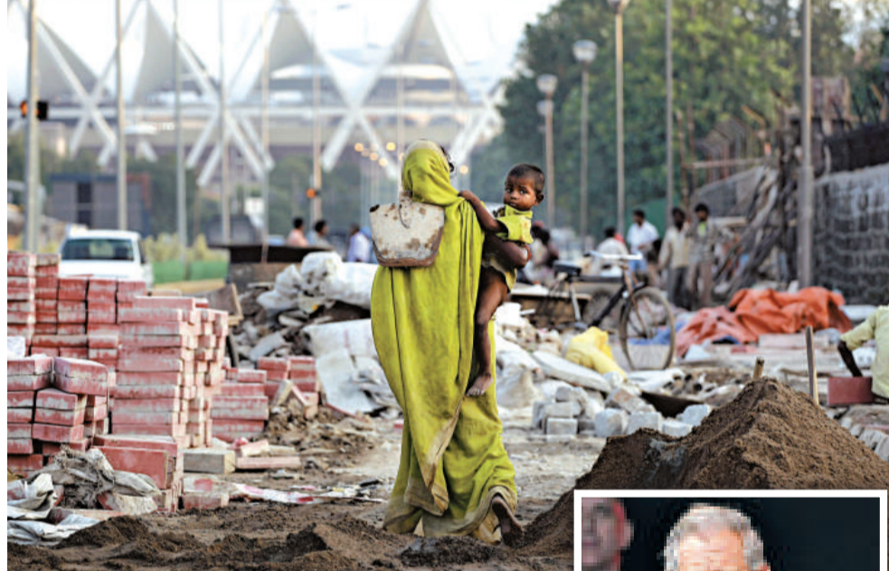
▲英聯邦運動會召開在即，新德里的主要體育場館還未完工