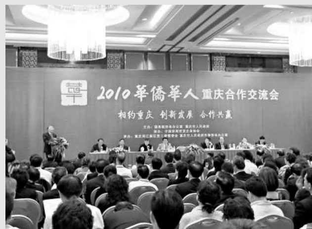
2010華僑華人重慶合作交流會開幕現場

商務部今天發布的終裁公告稱，在本案調查期內，美肉雞產品存在傾銷，中國國內產業受到實質損害，且傾銷與實質損害之間存在因果關係。2009年8月14日，調查機關收到中國畜牧業協會代表國內白羽肉雞產業提交的反傾銷調查申請，並於9月27日發布立案公告。