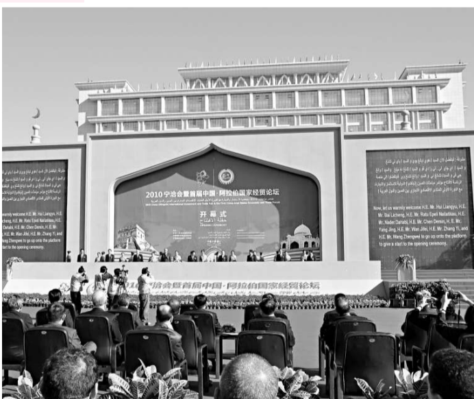
▲寧洽會暨首屆中阿經貿論壇開幕現場

此外，論壇舉辦期間，約旦、敘利亞和伊拉克國聯合舉辦了投資說明會，涉及的項目涵蓋了農業與水資源、衛生教育、製造業、交通物流、旅遊飯店及住宅商業地產開發等多個領域。