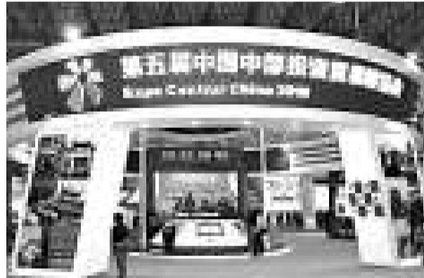
▲中博會吸引了中外客商前來尋找商機

另外，原定出席開幕式及高峰論壇的澳門特別行政區行政長官崔世安，其專機抵達南昌時因天氣惡劣未能降，已於25日返航澳門。據組委會消息，崔世安特首將缺席本屆中博會。