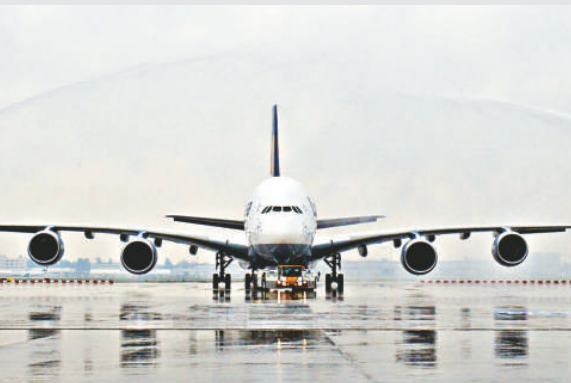
▲A380屬劃時代的超大型客機，機場須升級設備迎接

本港機場早前亦為迎接新加坡航空A380而改裝登機開口，並配備3條登機橋，目前亦正為阿航進行類似的改動，亦為未來迎來更多大型飛機做好準備。內地可達到A380起降標準的機場本身就不多，該機型勢必令航空流量管理面臨更為複雜的局面。基於A380載客量應大，首都機場正在空管協調、地動服務、加油車、登機橋，以至配餐等環節作出調整。