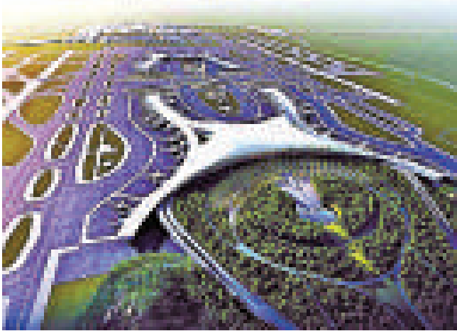
▲重慶江北機場 T3A 航站樓藍圖

基於去年貨量基數太低，大部分集箱海運航線貨量今年都錄得極大升幅。美銀美林稱，相比今年集箱海運需求增長16%的預測，明年需求增幅將大幅放緩至7%