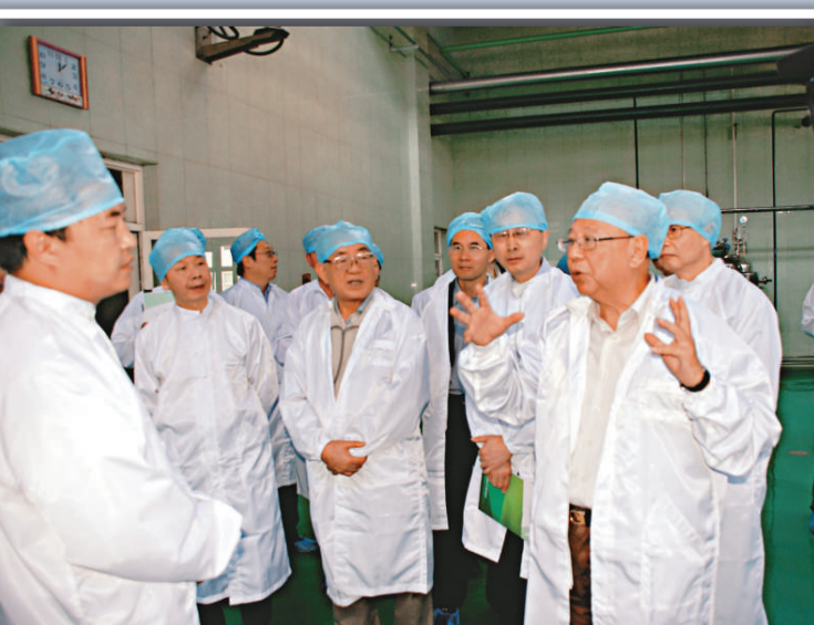
▲考察團團員參觀山西太行藥業