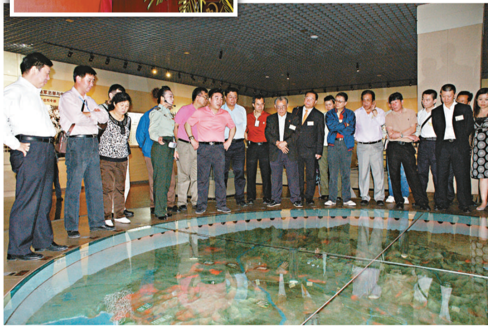
▲團員參觀當地紀念館