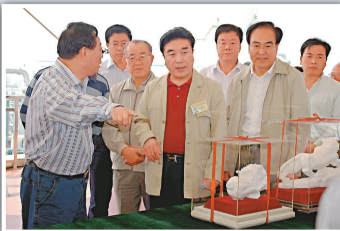
▲團員參觀山西路安集團，聽取領導簡介煤基合成油的示範項目