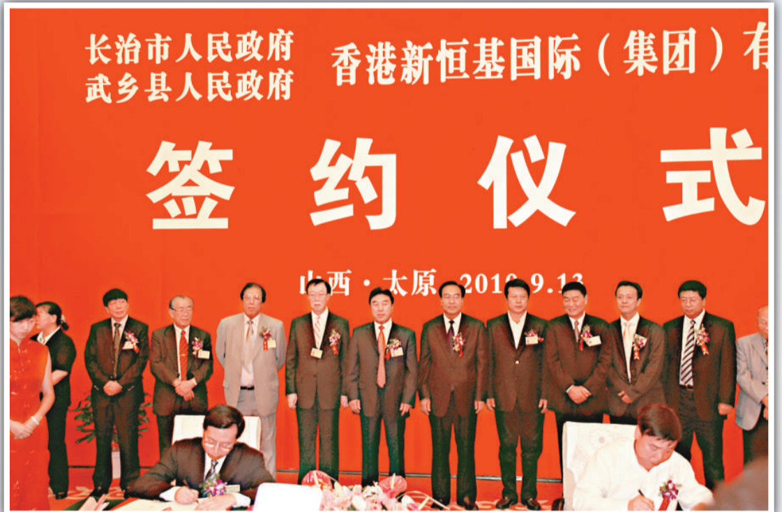
▲香港新恆基國際（集團）有限公司在領導們及考察團成員的見證下簽約