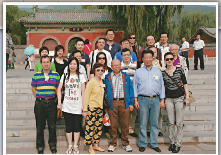
▲考察團到訪全國重點文物保護單位——晉祠