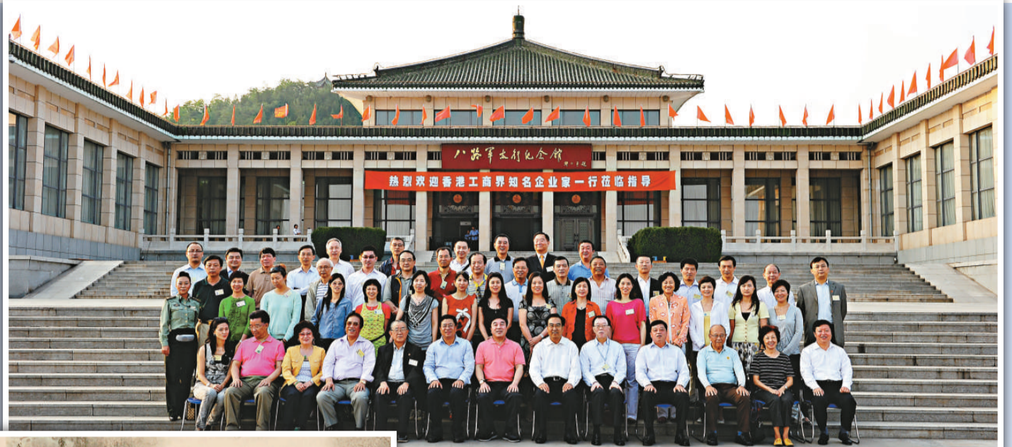
▲考察團參觀八路軍太行紀念館後合照留念

團員考察山西期間，先後到訪傳統革命老區，先後參觀八路軍太行紀念館、八路軍總部舊址博物館，緬懷八路軍的抗日英姿；登上太行山，遠眺群山萬壑的雄奇險怪；參觀晉祠、平遙古城及喬家大院，體驗山西省獨特深厚的文化底蘊，考察團於十四日順利結束行程返港。