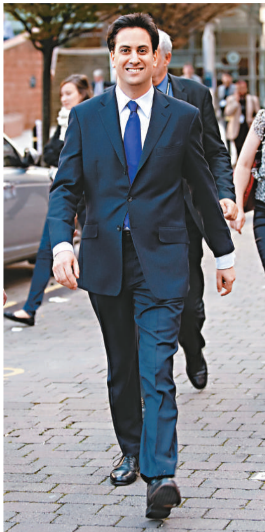
▲文立彬宣告新工黨時代過去

【本報訊】據英國廣播公司、《每日郵報》二十七日報導，英國在野工黨新任黨魁文立彬宣布新工黨時代已經過去，強調工黨必須打破兩名前任黨魁貝理雅及白高敦定下的信條，而且用行動證明：他支持高稅收、淡化工黨把赤字減半的選舉承諾，並拒絕就公營機構罷工譴責工會。