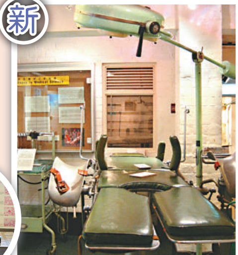
▲▲展廳內展示各式醫療器具（祁文攝）