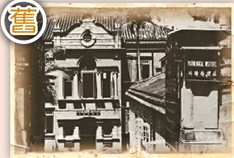
香港醫學博物館昔日是細菌學檢驗所（網上圖片）