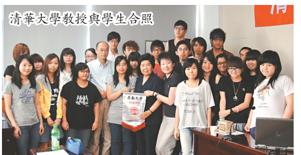
清華大學教授與學生合照

國情研習是本次交流團的主題，校方安排清華大學教授為學生主講中國歷史文化，以及1949年後中華人民共和國在政治、經濟、外交、教育和科技五方面的發展，內容全面而剪裁得當，而且講解精闢，學生無不嘆服。筆者與兩名隨團老師也跟學生一起在教室內聽課，過過學生癮，有幸親聆清華名教授講課，與有榮焉！