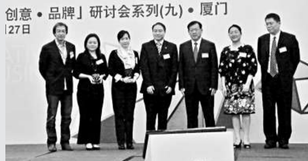
▲「香港·創意·品牌」研討會在廈門舉行