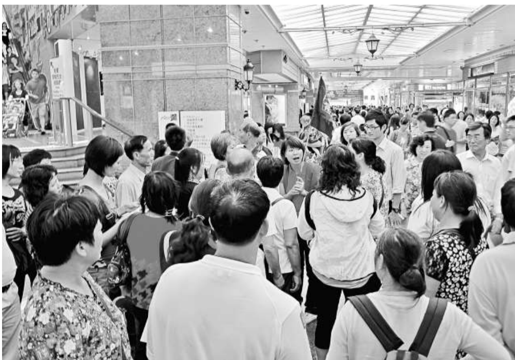
▲十一黃金周快將到，各大商場紛紛出招吸引內地客消費

內地黃金周假期將至，為吸引更多內地旅客，十月一日至七日期間，新地旗下大埔超級城、新太陽廣場、元朗廣場等五個商場將推出購物獎賞，消費滿三千元可參加抽獎，有機會贏取 iPad、黃金、免費酒店住宿、現金券等。每日首一百名顧客，還可獲贈往返深圳的港鐵車票。