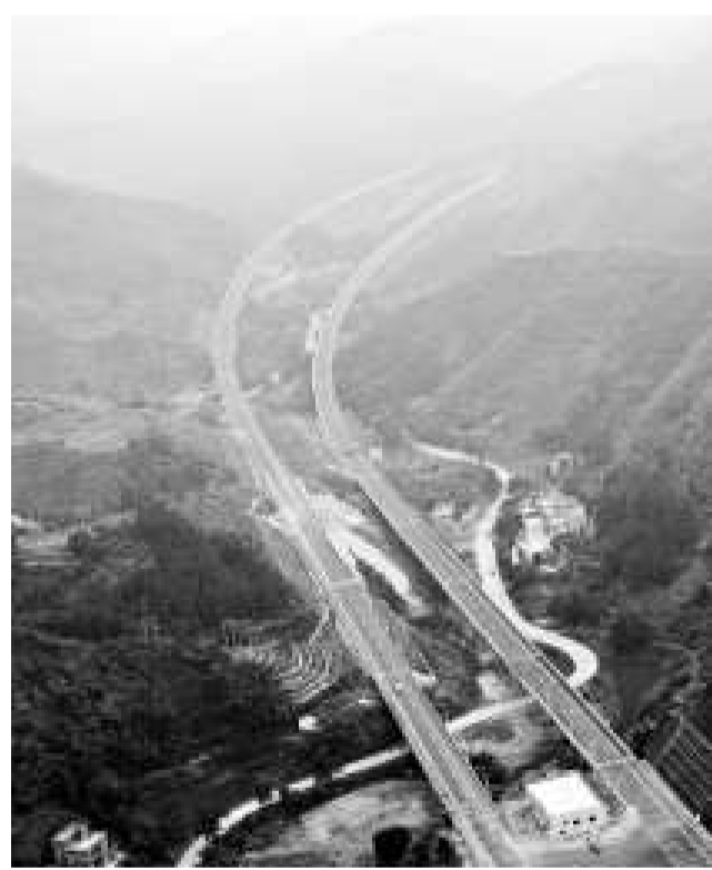
▲港珠澳大橋珠海段規劃配套方案出爐，圖為與大橋側連接接駁的高速公路網

另外，從本周五起珠海經濟特區範圍將擴至全市。珠海市交通運輸局今天透露，將以特區擴容三十二點六倍、港珠澳大橋興建為契機，逐步形成特區內「七縱六橫」公路交通網絡，打造成為珠江口西岸交通樞紐城市；其中港珠澳大橋珠海段規劃配套方案正式出爐，總投資超過一百八十億元(人民幣，下同)，將興建多條高速公路直駁大橋，打通港澳與粵西乃至泛珠區域的最快捷通道。