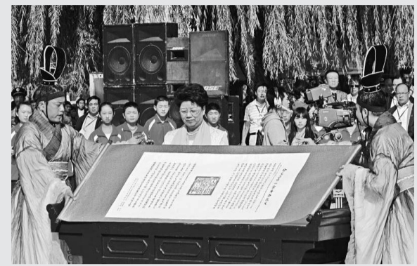
全國人大副委員長陳至立揭開庚寅年祭孔大典主題：世界大同、協和萬邦