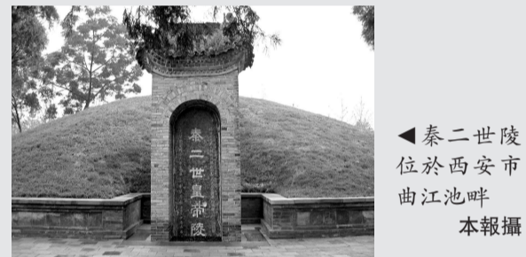
秦二世陵位於西安市曲江池畔