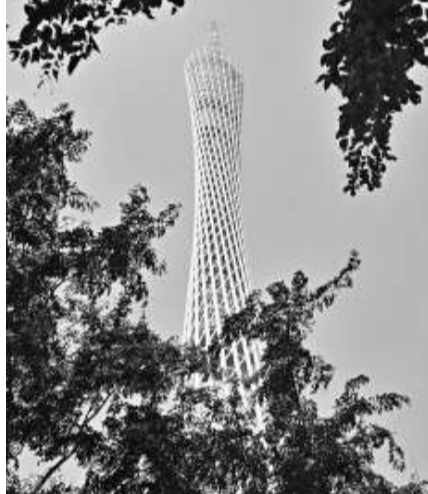
▲有「小蠻腰」美稱的廣州新電視塔 網絡圖片

【本報訊】俗稱「小蠻腰」的廣州新電視塔歷經三次徵名，最終以平不無奇的「廣州塔」定名，將在10月1日國慶日當天正式公開售票接待遊客。