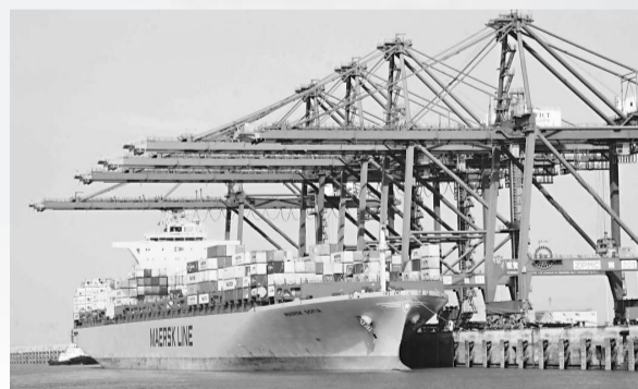
世界航運界巨頭馬士基航運公司在福州新港開闢歐地遠洋航線

去年歲末，由中海油總公司與福建省政府聯合開發的海西寧德工業區在福建寧德三都澳瀾南半島正式開建。該工業區規劃面積約228平方公里，目前正在加緊1000萬噸原油儲備、每年260萬噸LNG接收站及管網工程、海洋石油工業配套裝備等項目的前期建設。