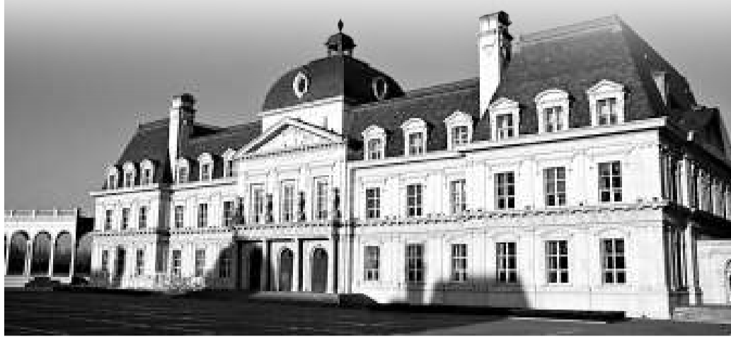
北京昌平的拉斐特城堡酒店

拉斐特城堡酒店位於昌平區北七家鎮，毗鄰風景秀麗的溫榆河。東距首都機場15公里，南距奧運村10公里，是按照五星級標準建造的高檔商務度假酒店。酒店由主城堡、東西配樓、模紋花壇、酒文化廣場組成，總建築面積2.4萬平方米。2008年北京奧運會時，俄羅斯代表團曾將該酒店作為大本營。入住城堡酒店的不僅有俄羅斯奧委會工作人員，還有俄羅斯政要、億萬富翁、演藝明星以及大批俄羅斯記者，他們被稱為俄羅斯VIP