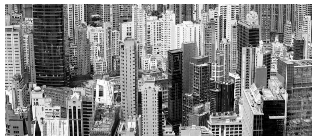
港府推出中小住宅地皮，以為增加上車盤數目，可助市民置業，這如意算盤恐怕打不響，尤其夾心階層愈來愈難上車