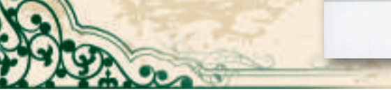
▲王仲華《嶠華山館叢稿》