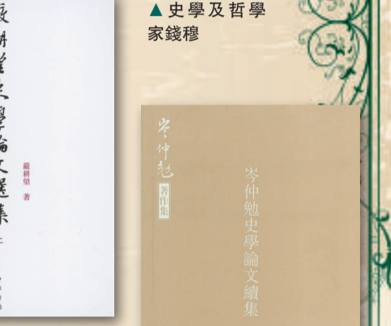
▲嚴耕望《嚴耕望史學論文選集》（上）