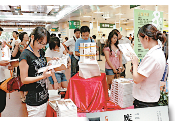
▲首發儀式現場，《廢墟上的神話》吸引了不少讀者的目光。 ▲《廢墟上的神話》紀錄了廣州援建災區威州鎮的歷程

由廣州作家團隊組成的援建紀實寫作組三赴汶川、歷時一年，終於創作出版了《廢墟上的神話》一書，日前在廣州舉辦首發式暨贈書儀式。該書的出版發行，既是奉獻給汶川災區重建家園的一份藝術禮物，也是廣州市文學藝術家奉獻給廣州人民的又一份鼓舞人的精神食糧。