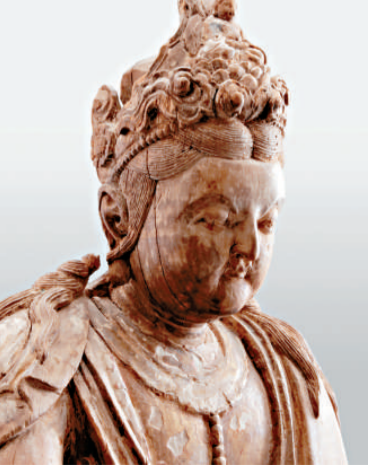
▲木雕觀音（十三至十四世紀）