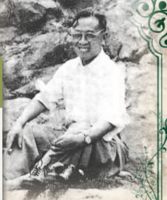
▲史學及哲學家錢穆