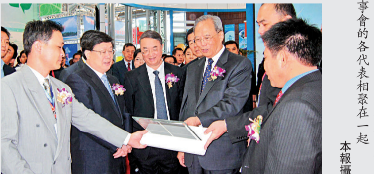
▲出席東亞運動會聯合會理事會的各代表相聚在一起。

爭標複賽方面，上屆冠軍澳洲及奪冠大熱美國雙雙贏波，以2戰全勝提早取得8強入場券。