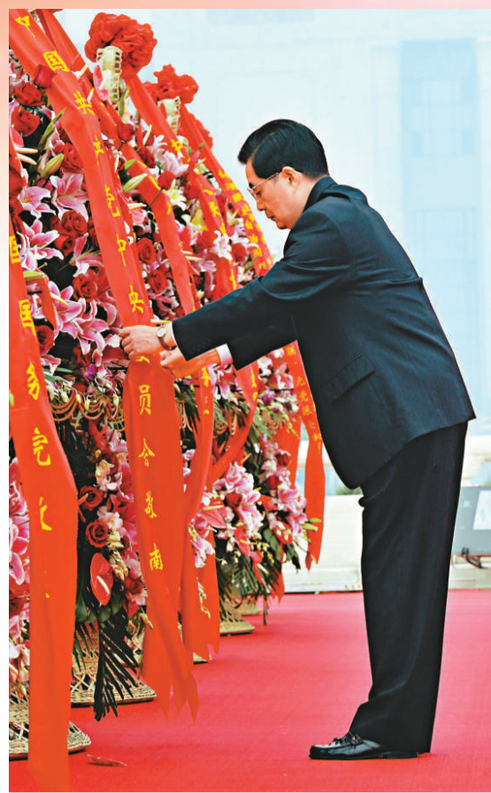
▲胡錦濤仔細整理花籃紅色綵帶

向人民英雄紀念碑獻花作為國慶日的固定儀式，從2008年國慶日開始舉行。2009年因為舉行國慶60周年閱兵而未能舉行。此前社會各界都曾呼籲，在國慶節日應以一種莊嚴肅穆有儀式感的國家級紀念活動表達全國人民對先烈的緬懷和敬意，從而激發民衆的愛國熱情和民族自豪感。