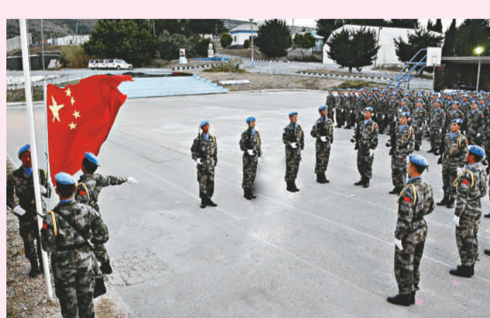
▲駐黎巴嫩南部的中國第七批維和工兵營營區內舉行升旗儀式，慶祝新中國61華誕

中國國際救援隊8月27日抵達巴基斯坦南部受災最嚴重的特達地區，重點進行醫療救助。截至目前，100多名救援隊員已累計救助當地患者約25000人次。