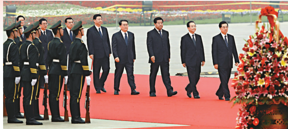
▲胡錦濤等中央高層1日出席首都各界向人民英雄紀念碑敬獻花籃儀式