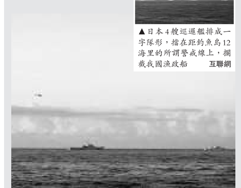
▲日方高速巡邏艦和直升機聯合跟蹤我漁政船 202 互聯網