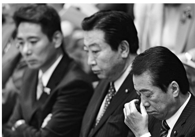
▲日本眾議院會議上，議員繼續關注釣魚台事件 路透社

藤田公司方面稱，職員們由於未注意到「軍事禁區」的標示，在寫有「警戒線」的關口前拍了照。據悉，中方在拘留期間的審查中很有禮貌，他們飲食及住宿等方面都受到了人道主義的對待。