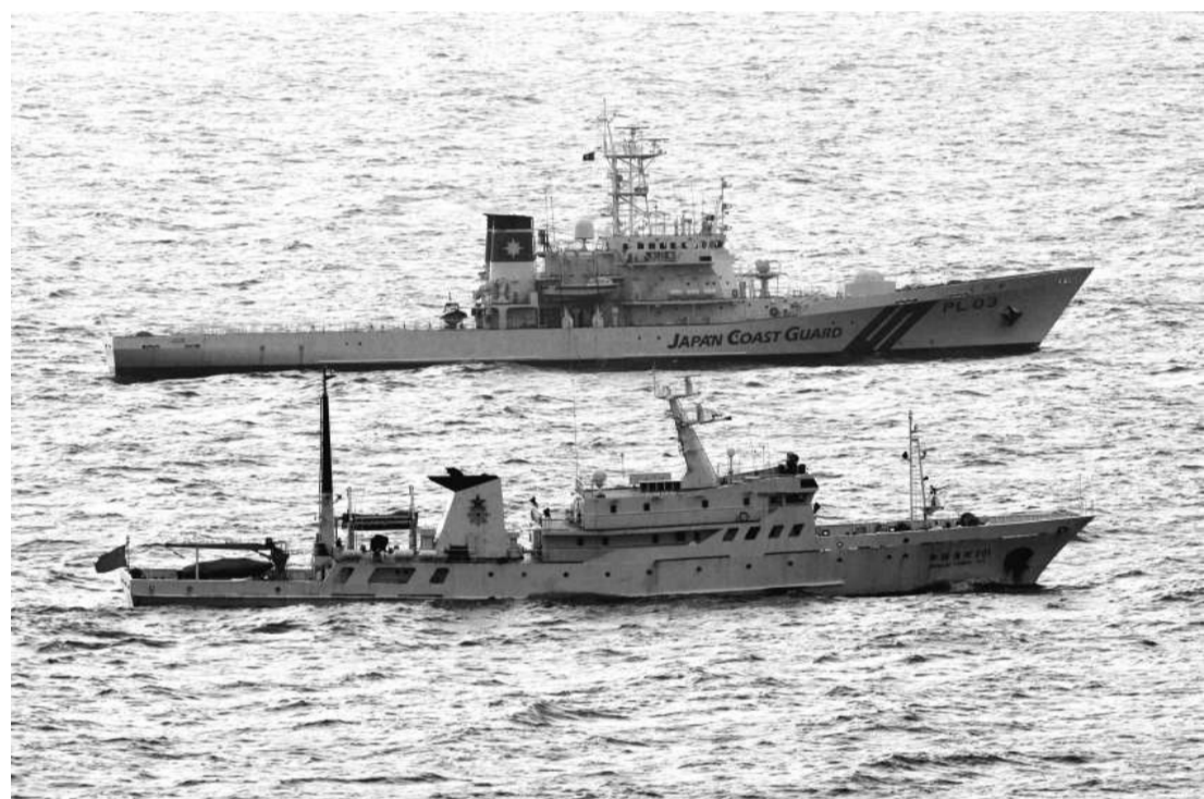
▲9月28日，日本巡邏艦在釣魚島海域與我漁政船對峙