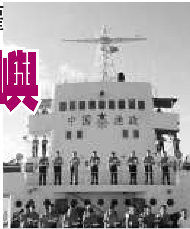
▲中國派出漁政船在釣魚島海域保護中國漁民作業，宣示維護主權的決心 互聯網

赤尾嶼是釣魚島列島最東端的島嶼，面積為0.195平方公里，亦稱赤嶼、赤坎嶼、赤尾山、赤尾島、赤尾礁，屬於中國固有領土。