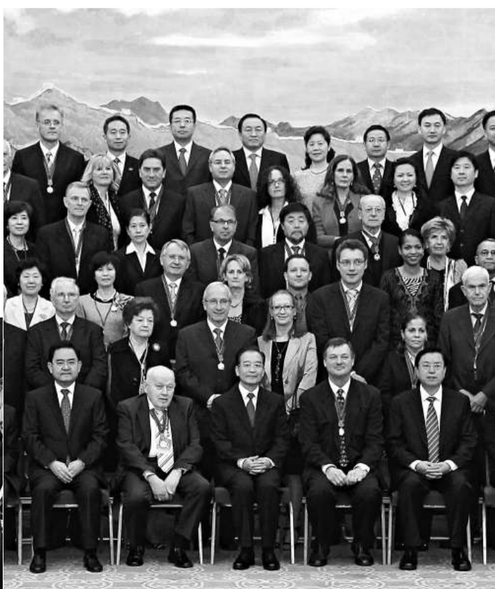
▲◀30日，溫家寶在北京人民大會堂會見榮獲2010年度中國政府「友誼獎」的外國專家及其眷屬

「友誼獎」是中國政府為在中國經濟建設和社會發展中做出突出貢獻的外國專家設立的。本年度獲獎的50名外國專家分別來自16個國家，涉及工農業、能源環保、教育科技、醫療衛生、文化體育等領域。自1991年設立「友誼獎」以來，共有來自60個國家的1149名外國專家獲獎。