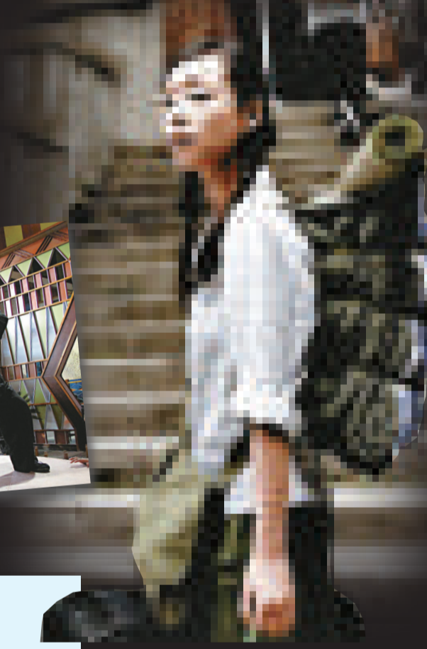
▲洪金寶憑《狄仁傑之通天帝國》(圖)和《葉問2》獲動作設計提名