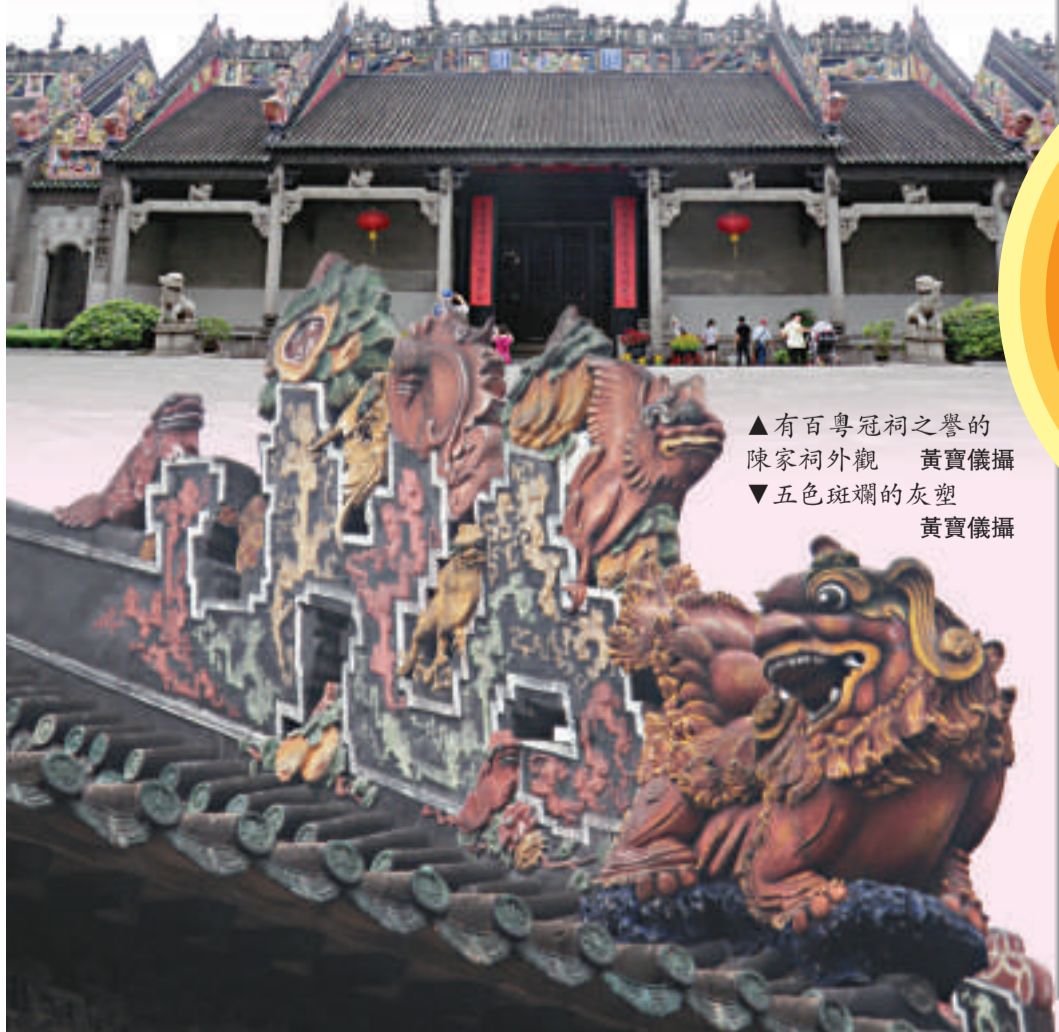
▲有百粵冠祠之譽的陳氏祠外觀 黃寶儀攝 ▼五色斑斕的灰塑 黃寶儀攝

早在1959年，陳氏書院已經被政府闢為廣東民間工藝博物館，收藏、研究、展出以廣東地區為主兼及全國各地的歷代民間工藝品。如今館內分別陳列陶瓷、刺繡、雕刻等數十種珍貴文物和反映嶺南民俗風情的民間工藝品，包括廣州燈籠、金銀工藝、套色蝕花玻璃；有佛山燈籠、剪紙、木刻、門面等；有潮州麵塑、稿末塑、麥稈貼畫的剪紙；還有陽江、潮汕、佛山地區的漆器，以及少數民族地區工藝等。陳氏書院巧壓天工的建築裝飾藝術與廣東歷代民間工藝精品共冶一室，交相輝映，使遊客一次得到旅遊休閒和藝術觀賞的雙重享受。