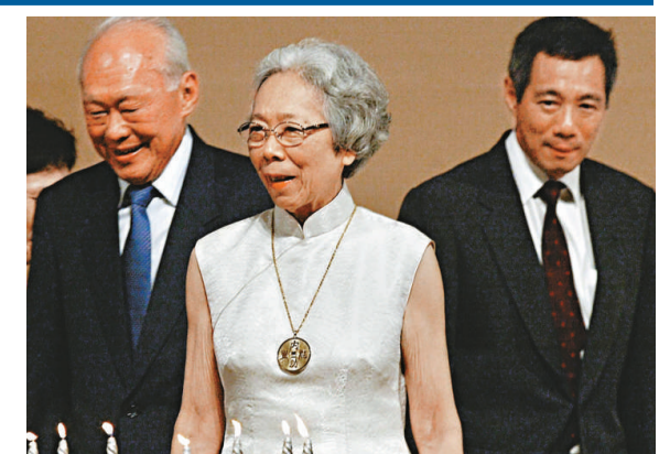
▲2003年9月，柯玉芝與丈夫李光耀(左)、長子李顯龍(右)

李光耀於1959年新加坡自治邦成立後出任總理；1965年新加坡獨立後，長期擔任總理；1990年11月辭去總理職務，改任內閣資政。而八十七歲的李光耀，星期三因為胸腔感染入院留醫，目前情況良好。