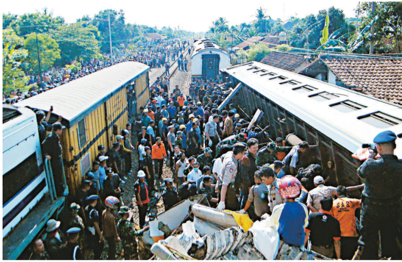
▶ 印尼救援人員試圖將困在出軌車廂裡的死傷者救出

【本報訊】綜合外電雅加達二日消息：印尼中部周六發生一列火車從後撞上另一列火車的意外事故，造成至少36人死亡，100多人受傷的慘劇。