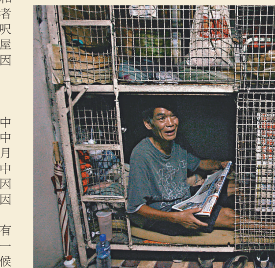
籠屋單位狹窄，居民生活環境惡劣。