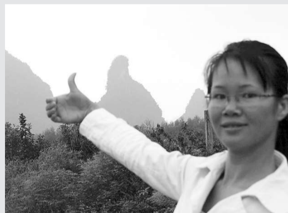
桂林發現「拇指峰」 在位於廣西桂林市平樂縣源頭鎮橋板村的323國道809公里處的西面方向，一座酷似人類大拇指的山峰日前被途經的路人拍到。