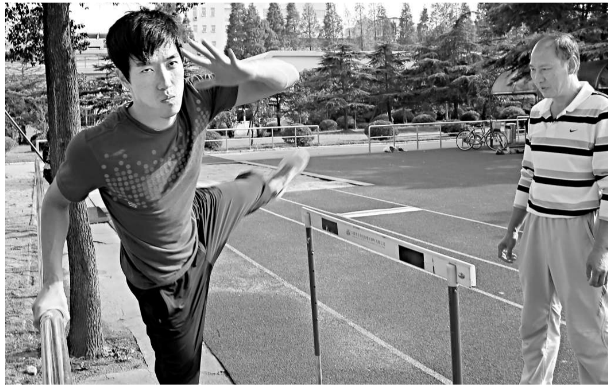
▲相比兩年前商業贊助的火爆，劉翔今年的商場成績「0分」，比賽場成績更加慘不忍睹。圖為劉翔昨天在上海莘莊基地進行原地跨欄訓練，備戰下月在廣州舉行的亞運會

該媒體為證明劉翔的億元身價，甚至還做了相應的計算。該媒體載文稱，2004年雅典奧運奪冠後，劉翔的代言費從35萬元飆升至逾千萬元。儘管劉翔沒有「翔之隊」，且其商業開發由田徑管理中心統一管理；劉翔的商業開發分三級，五家一級代言，每年1000萬至1200萬元，回報是出席兩次活動、拍攝一次廣告；二級代言為每年600萬元左右，不出席活動，不到專門影棚及地點拍攝廣告，但可在訓練中或訓練後採拍畫面；三級代言則僅用現有畫面作廣告宣傳。儘管2008年京奧退賽後，劉翔商業價值大幅縮水，但他年收入依然高達數千萬元。